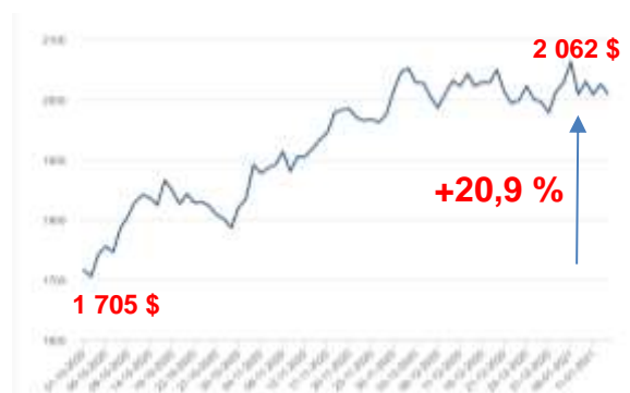
График изменения цен на алюминий на LME, USD с 1 октября 2020 года

Все спецификации, подтвержденные и оплаченные до 01 февраля 2021 года, будут выполнены по ценам до повышения. С 01 февраля будут действовать новые цены.