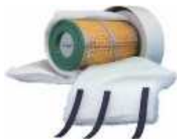
Рис.2 Установка СФ в УПЗ