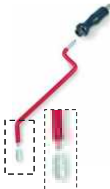
Схема проведения процедуры: