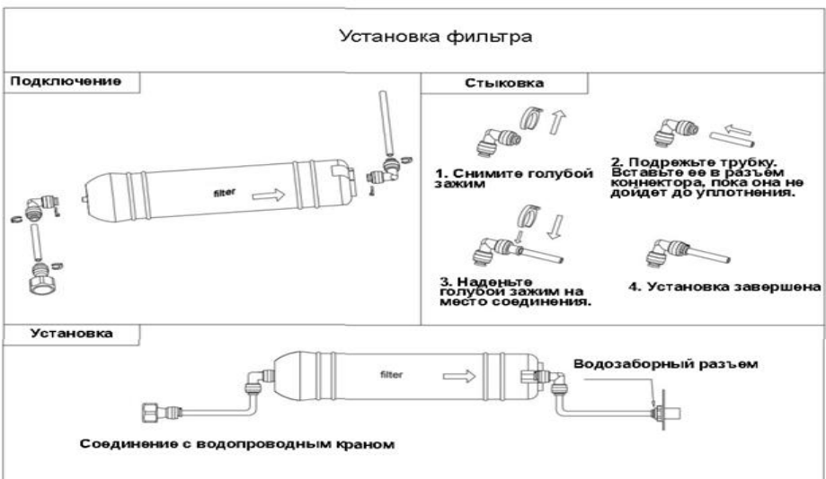
Рис.2 Схема подключению к водоснабжению.