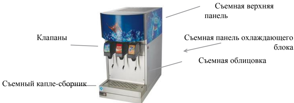
Рис 1 Основные элементы