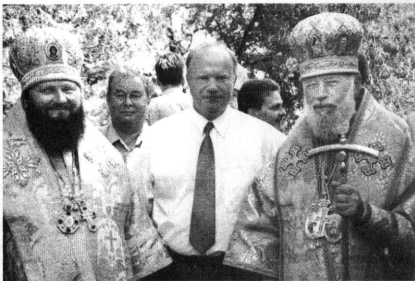
Встреча со священноначалием Украинской Православной Церкви.