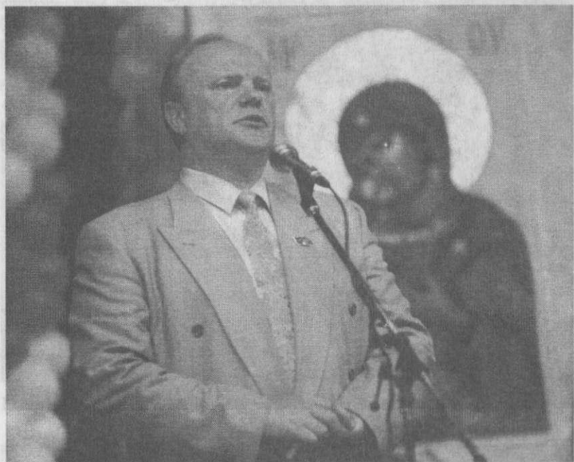
Духовное возрождение России – в центре внимания коммунистов.