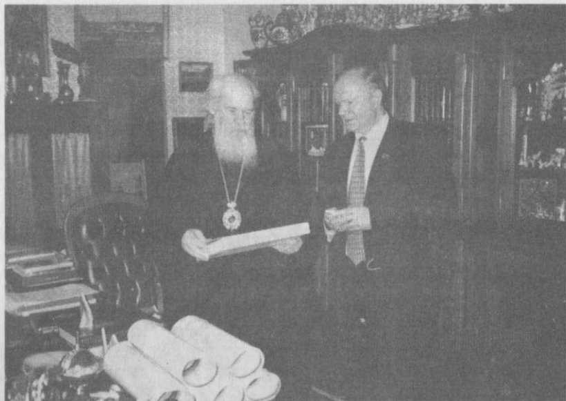
В резиденции у патриарха Московского и всея Руси Алексия II.