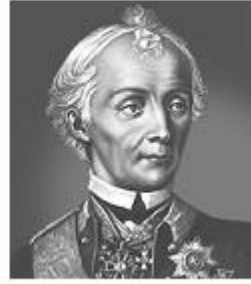
А. В. Суворов