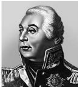
М. И. Кутузов