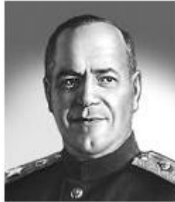
Г. К. Жуков