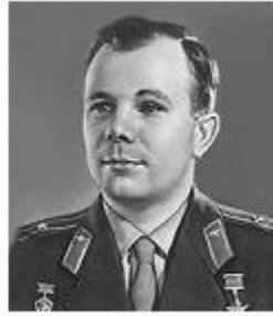
Ю. А. Гагарин