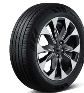
19인치 전면가공 휠