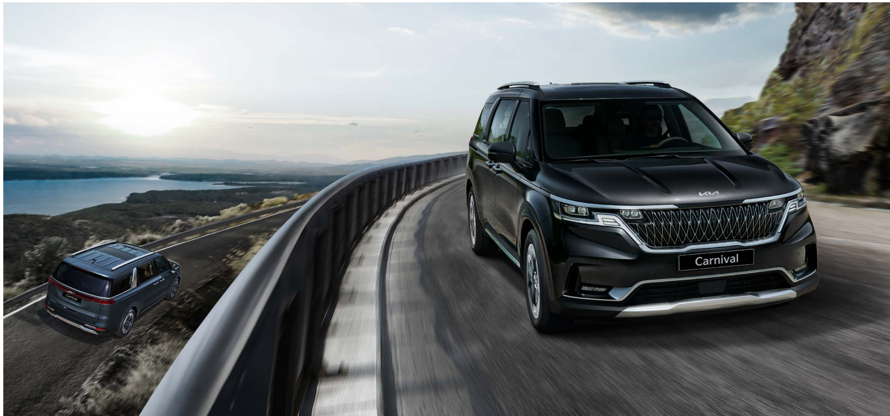
좌: 아스트라블루 (D2U) / 우: 오로라블랙 펄 (ABP)