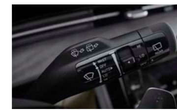
우적감지 와이퍼 (레인센서)