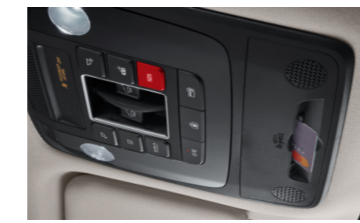
하이패스 자동 결제 시스템