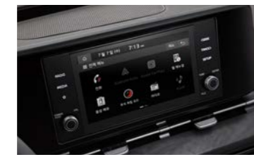
8인치 디스플레이 오디오