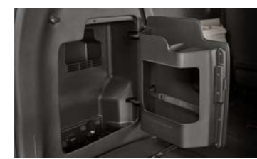
도어타입 러기지 트레이 (7인승 운영)