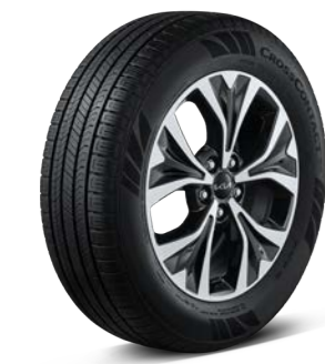
18인치 전면가공 휠