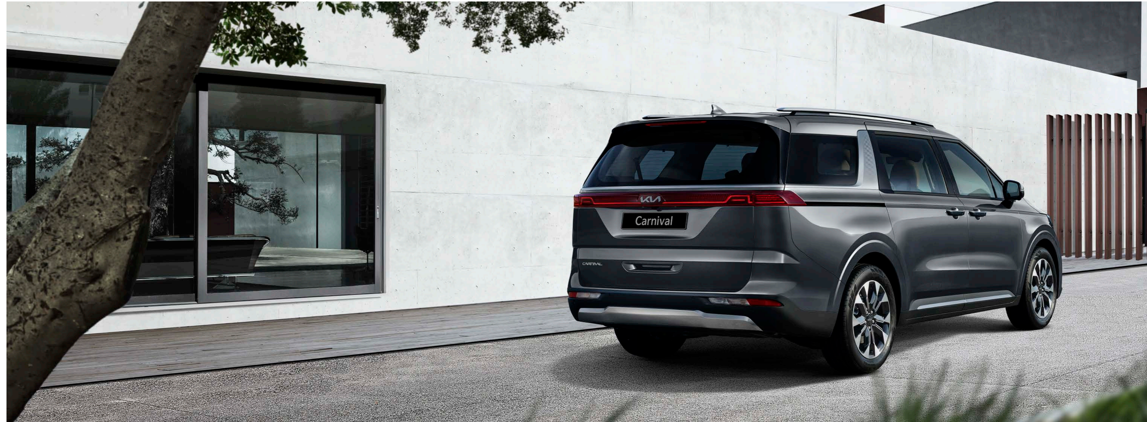
판테라 메탈 (P2M) 상기 사양구성은 트림, 인승 모델별, 엔진, 선택 사양에 따라 다르게 적용됩니다