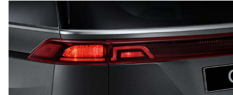
별브 리어 콤비네이션램프