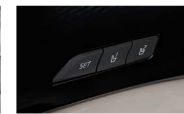
운전 자세 메모리 시스템