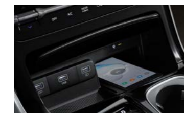
스마트폰 무선충전 시스템