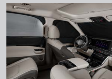
멀티 커튼 (전면/1열/2열)