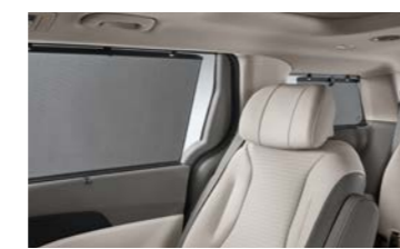
2/3열 측면 수동 섀터튼