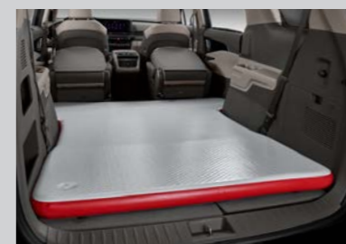
에어 매트 (7인승 아웃도어 전용)