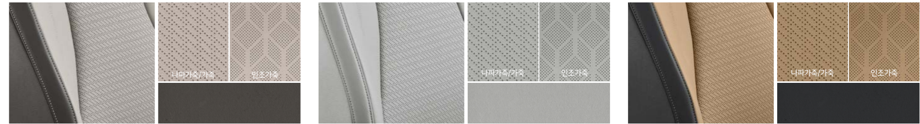
코튼 베이지 (나파가죽/가죽/인조가죽)