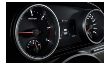
슈퍼비전 클러스터 (4.2인치 칼라 TFT LCD)