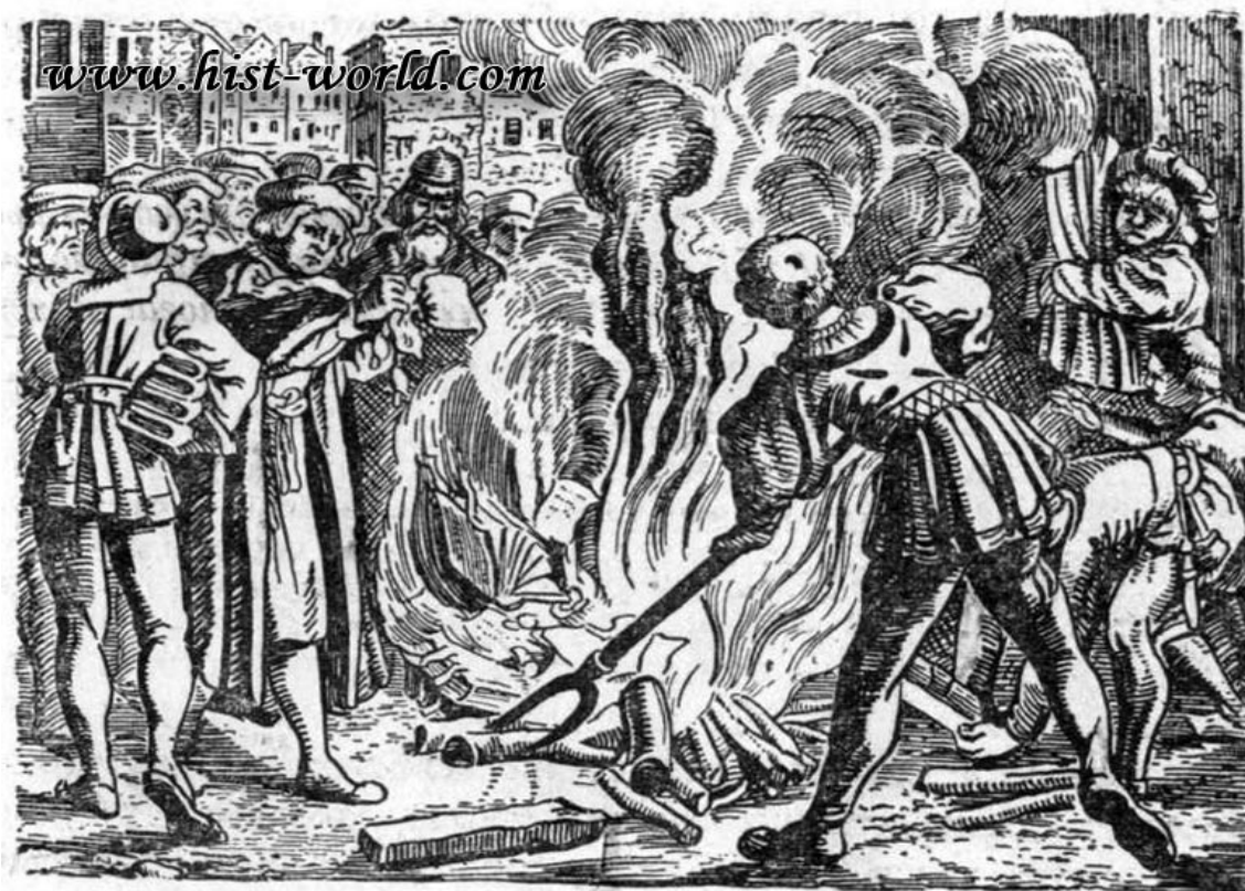
Рис. 81. Лютер сжигает папскую грамоту.