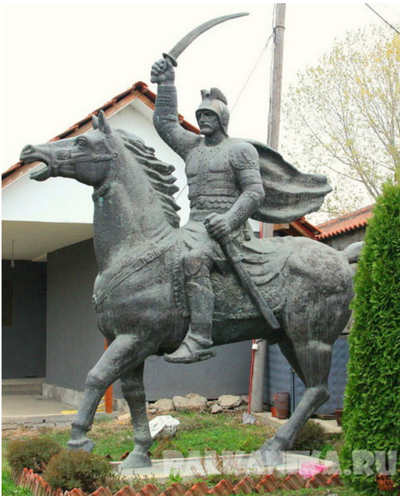
Памятник Милошу Обиличу