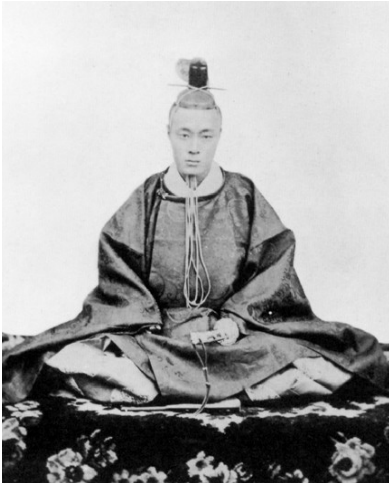
Сёгун Токугава Ёсинобу