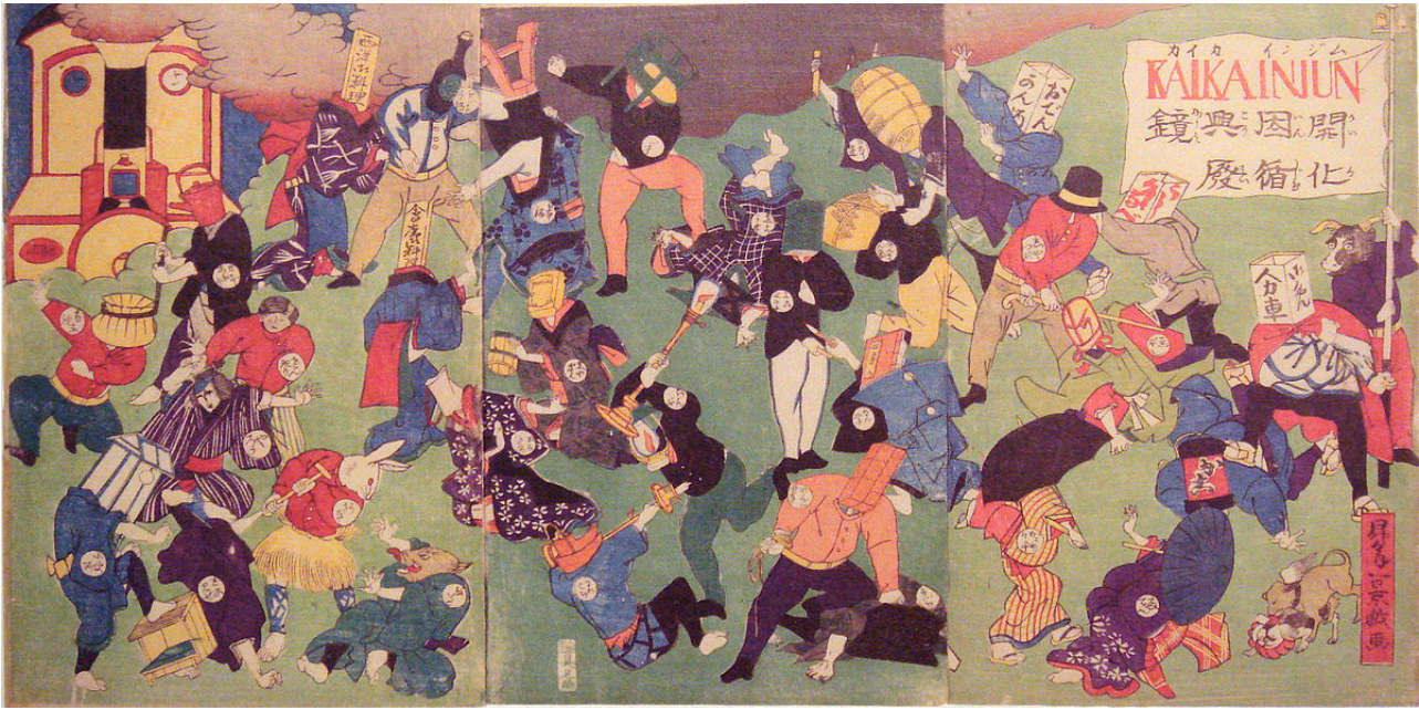
Аллегория борьбы нового и старого, картина около 1870 года

Жизнь японцев изменилась. На смену деревянным домам пришли каменные, появилась мода на европейскую жизнь и стиль одежды. В 1872 году Япония перешла на григорианский календарь. В крупных городах возникали газеты и журналы. Япония развивалась и обретала могущество, постепенно она стала требовать пересмотра ранее заключенных кабальных торговых договоров на международной арене. Закономерным итогом многочисленных реформ правительства Мэйдзи стал проект Конституции. Документ не только определял статус императора и органов власти, но также закреплял перечень прав и свобод обычных граждан. Конституция вступила в силу в 1890 году.