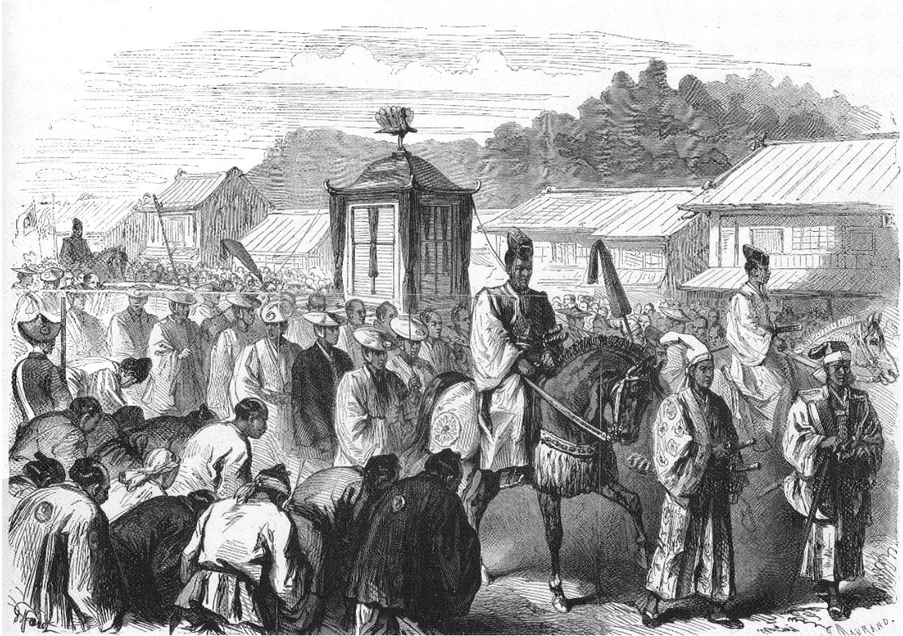
16-летний император в пути из Киото в Токио

Император Муцухито уже через три месяца своего правления объявил программу, которая и послужила началом кардинальных перемен в жизни Японии. Программа получила название «Клятвы пяти пунктов» и гласила: