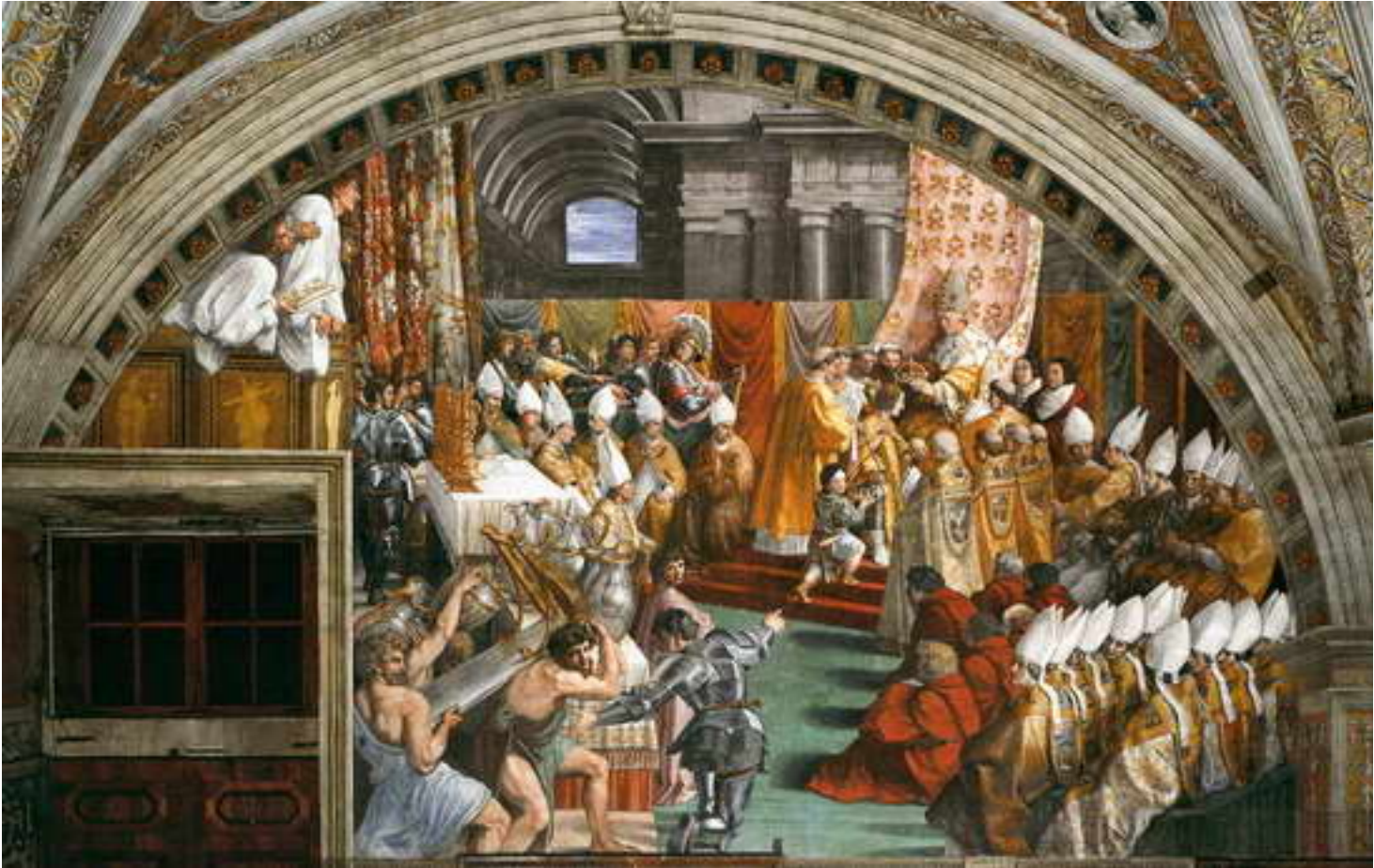
Рафаэль. Коронация Карла Великого, ок. 1516-1517

Славы и могущества Карл Великий достиг своими выдающимися личными качествами. Сам почти неграмотный, Карл всеми мерами старался распространять просвещение и привлекал к себе на службу известных ученых (богословов Алкуина и Рабана Мавра, историков Павла Диакона и Эйнгарда и др.). Как администратор, Карл Великий был бесспорно крупной фигурой. По его распоряжению были собраны, исправлены и систематизированы все старинные постановления о порядке несения общественной и военной службы. Эти постановления, известные под названием «капитуляриев», дополненные новыми законами , точно определяли, кто какую службу и в каком порядке обязан нести.