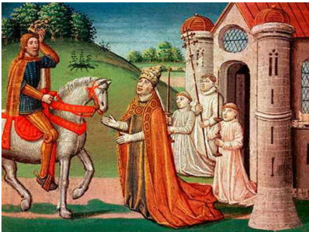
Карл Великий и папа Адриан I. Миниатюра XV века

В 775 г. возобновилась война с саксами, во главе которых стал Видукинд. Разделив войска на несколько армий, Карл Великий двинул их через Рейн и, разрушая на пути все города и селения, одержал над саксами ряд блестящих побед и покорил множество племен, заставив их силой принять крещение (777).