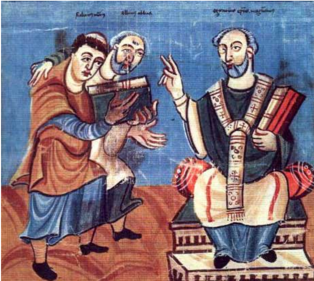
Алкуин и Рабан Мавр - учёные светила двора Карла Великого

Во всех своих владениях, старых и вновь присоединенных, Карл Великий вводил однообразную административно-военную систему, по которой страна делилась на дружины или корпуса (герцогства и графства), а последние - на тысячи, сотни и десятки, которыми управляли герцоги, графы, тысячники, центграфы, капитаны и пр. Пограничные области составляли маркграфства, и власть маркграфов была более обширна, чем у «обычных» графов. В силу капитуляриев Карла Великого, все свободнорожденные мужчины обязаны были нести военную службу сообразно своему состоянию. Так, имевшие 12 дворов должны были выходить на войну в полном вооружении, на коне; имевшие 4 двора - шли в поход лично, а менее 4 дворов соединялись в группы