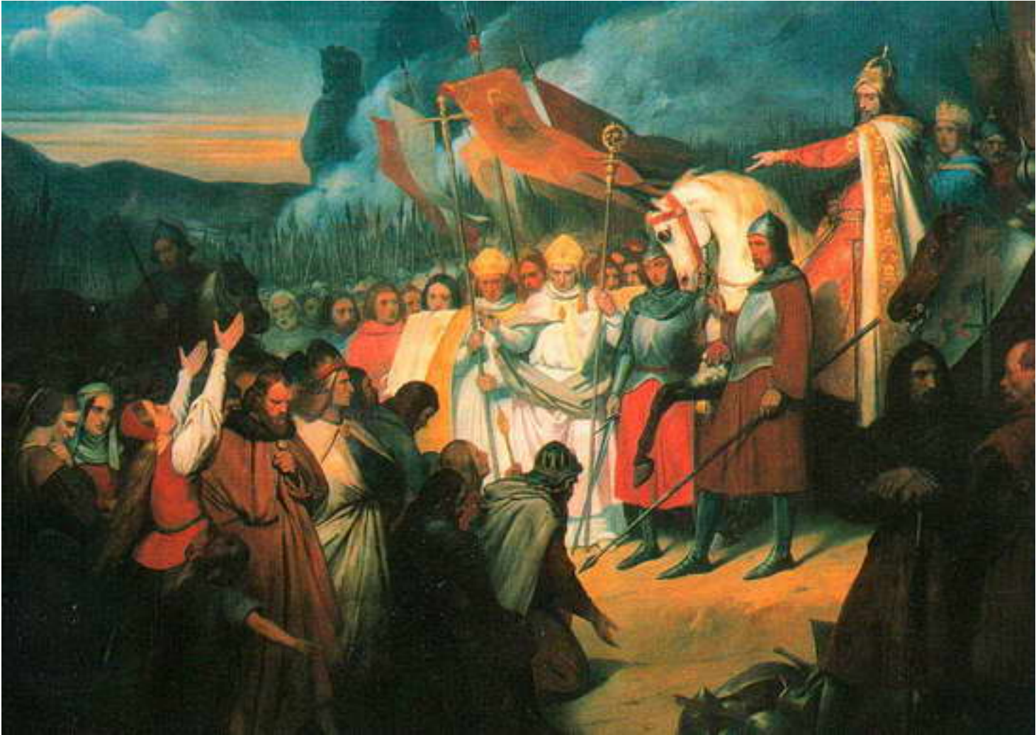
Видукинд приносит присягу верности Карлу Великому в Падерборне, 785 г. Художник А. Шеффер, 1840

В 786 г. против Карла образовали союз герцоги Баварский и Беневентский, призвав к себе на помощь аваров . Не давая времени врагам соединиться, Карл Великий разбил сначала герцога Беневентского и отнял его владения, потом двинулся на Баварского герцога Тассилона. Окружив баварцев при Аугсбурге, Карл заставил их просить мира. Тассилон добровольно сдался франкам . Наряженный над герцогом баварским суд приговорил его к смерти, однако Карл довольствовался заключением его с сыном в монастырь. Явившиеся на помощь баварцам авары были отброшены к Дунаю, в древнюю Паннонию. Следуя своей постоянной тактике, Карл Великий разделил армию на 3 части: одну он отправил по левый берег Дуная, сам пошел по правому берегу, а третью посадил на лодки, вместе с