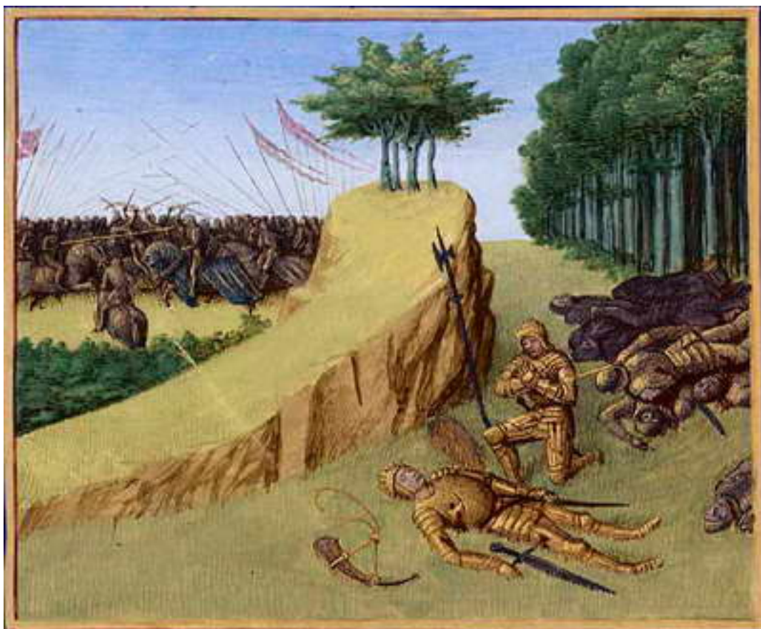
Смерть Роланда. Художник Ж. Фуке, ок. 1455-1460

В 781 г. Карл Великий опять отправился в Италию, чтобы усмирить мятеж, поднятый Адельхисом сыном Дезидерия, бывшего короля лангобардов, по наущению герцога баварского Тассилона. Адельхис при поддержке ещё и византийцев пытался восстановить независимость лангобардского государства, но безуспешно. Во время этого похода папа короновал сыновей Карла Великого : Пипина - будущим королем Италии, а Людовика - Германии.