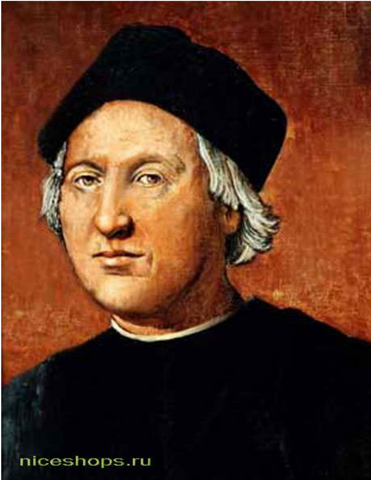
Портрет Христофора Колумба — открывателя Америки, испанского