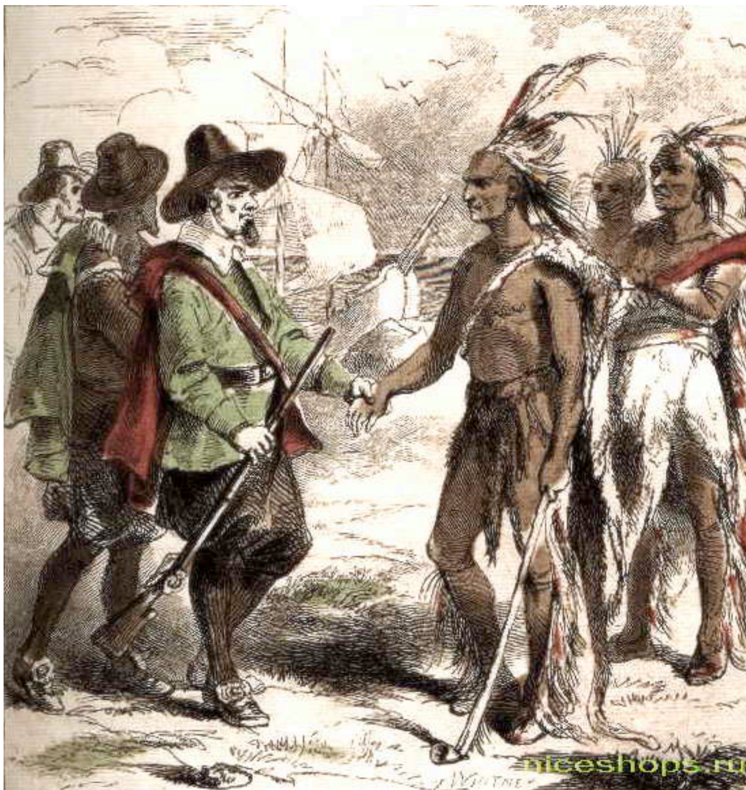
Первая встреча испанских мореплавателей с индейцами Америки