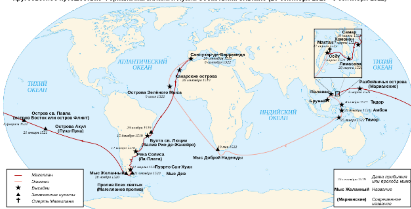
Кругосветное путешествие Фернана Магеллана и Хуана Себастьяна Элькано (20 сентября 1519 - 6 сентября 1522)

В марте 1518 года в Севилью в Совет Индии явились Фернан Магеллан и Руй Фалейру, португальский астроном, и заявили, что Молукки — важнейший источник португальского богатства — должны принадлежать Испании, так как находятся в западном, испанском полушарии (по договору 1494 г.), но проникнуть к этим «Островам пряностей» нужно западным путем, чтобы не возбудить подозрений португальцев, через Южное море, открытое и присоединенное Бальбоа к испанским владениям. И Магеллан убедительно доказывал, что между Атлантическим океаном и Южным морем должен быть пролив к югу от Бразилии.