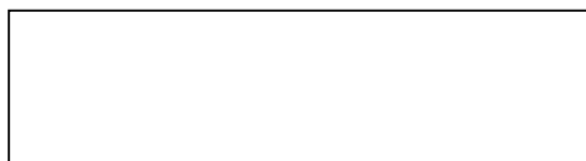
Рисунок 1 – Текст

Текст. Текст. Текст. Текст. Текст. Текст. Текст. Текст. Текст. Текст. Текст. Текст. Текст. Текст. Текст. Текст. Текст. Текст. Текст. Текст. Текст. Текст. Текст. Текст. Текст. Текст. Текст. Текст.