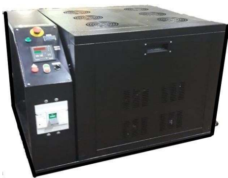
Рис.1. Общий вид парогенератора

Парогенератор по заказу комплектуется выходным паровым быстроразъемным соединением (БРС) с помощью которого через гибкий паровой рукав установка подсоединяется к паропотребляющему оборудованию.