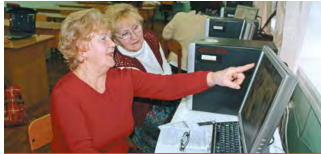
Курсы компьютерной грамотности в Борисоглебске в 2016 году. Подобное обучение планируют сделать и в Макашевке

При наличии компьютера вроде бы просто держать связь со всем миром, но оказалось,