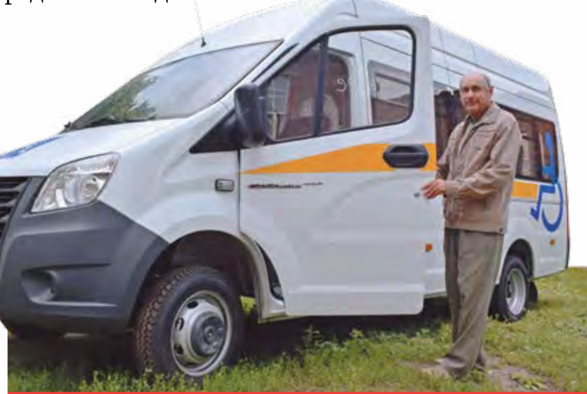
Новый автомобиль оснащен оборудованием для подъема в салон инвалидов-колясочников и их перевозки

Средства на автомобили поступили из федерального бюджета. Затем региональный де-