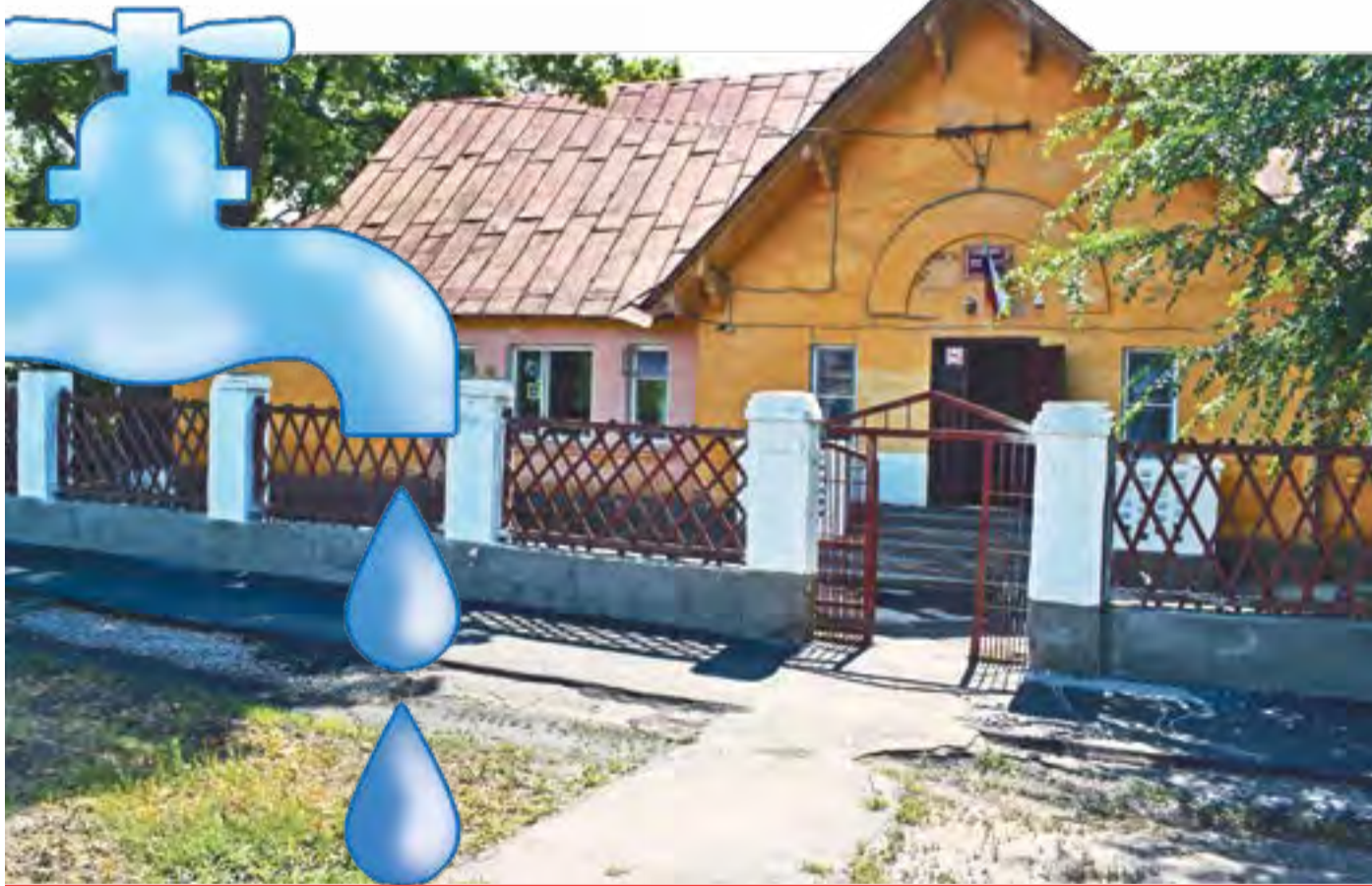
Корпус детского сада № 1, где произошла авария водопровода

В администрации детского сада № 1 возмутились: устраняли аварию сетей водопровода сами, а благодарность получил депутат