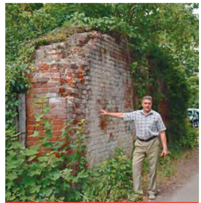
Сохранилась и часть стены спиртзавода по улице Терешковой

Елена ШЕРГЕЛЮК