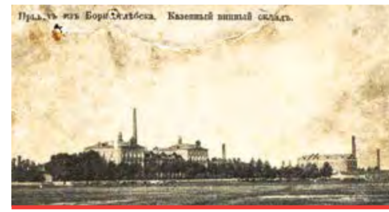
Так выглядел борисоглебский спиртзавод до пожара

Спирт из природного сырья в Российской империи по-прежнему производили на многочис-