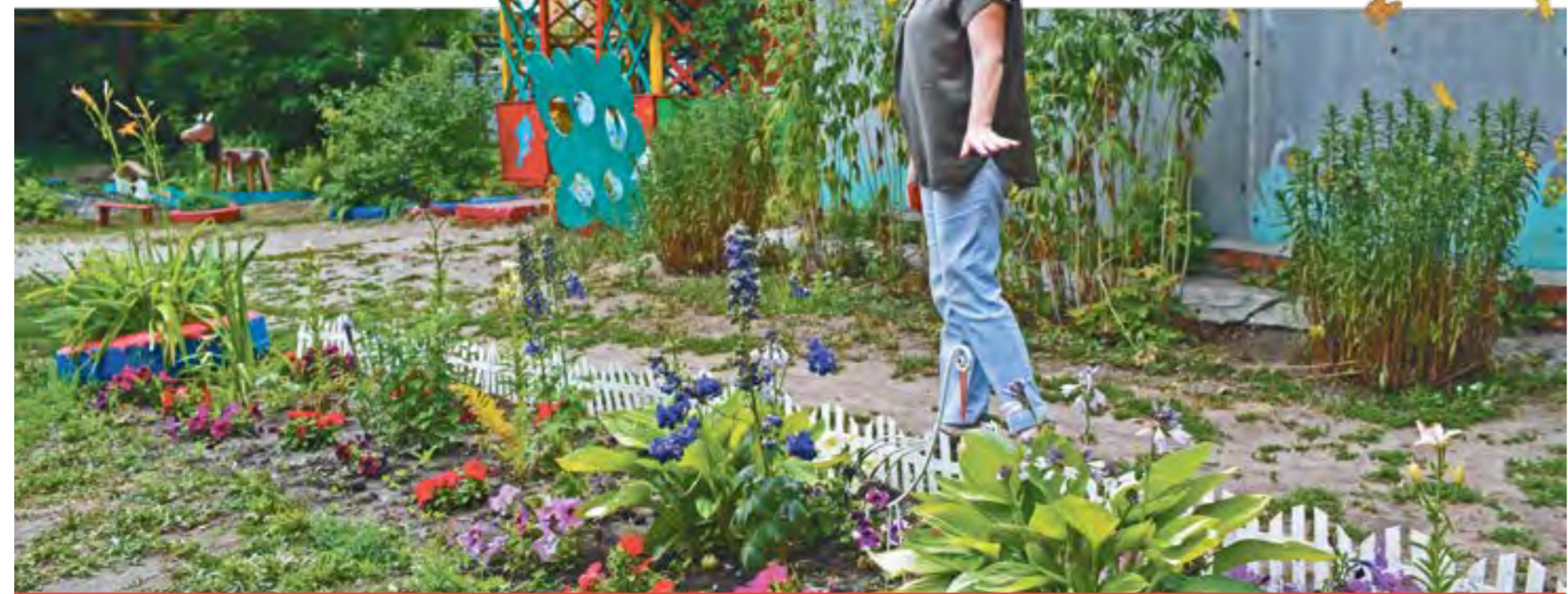
Привозной воды хватало и на полив клумб внутри двора, так что цветы во время длительного отключения даже не завяли