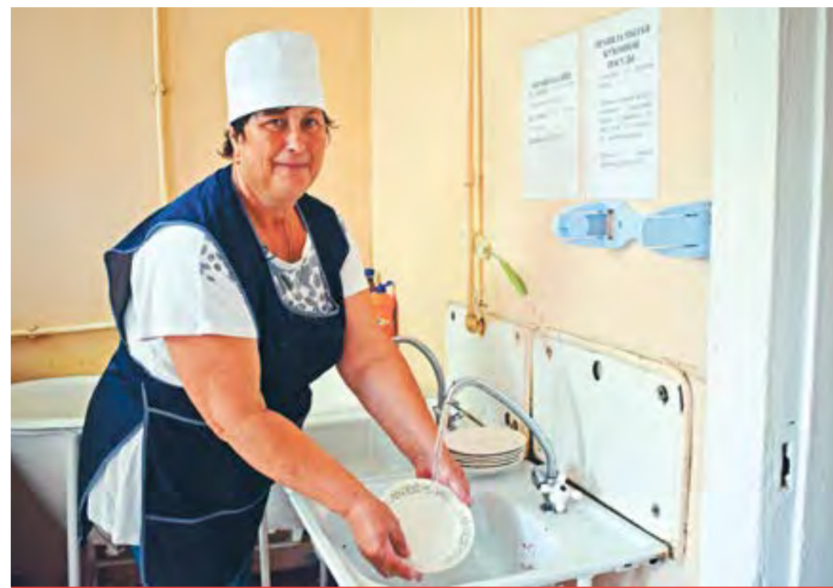
Воду в саду дали 28 июня после почти трех недель устранения аварии