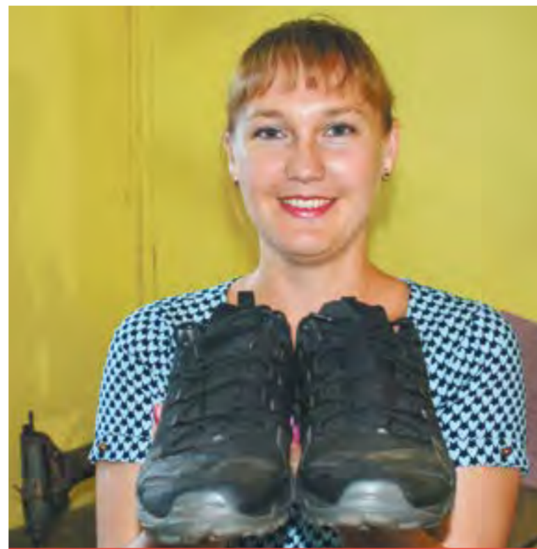
Готовое изделие – прошитые кроссовки