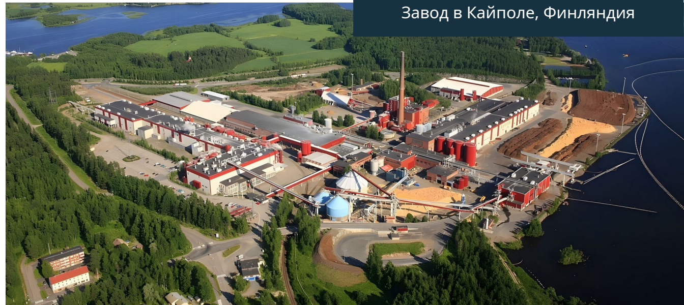
Завод в Кайполе, Финляндия