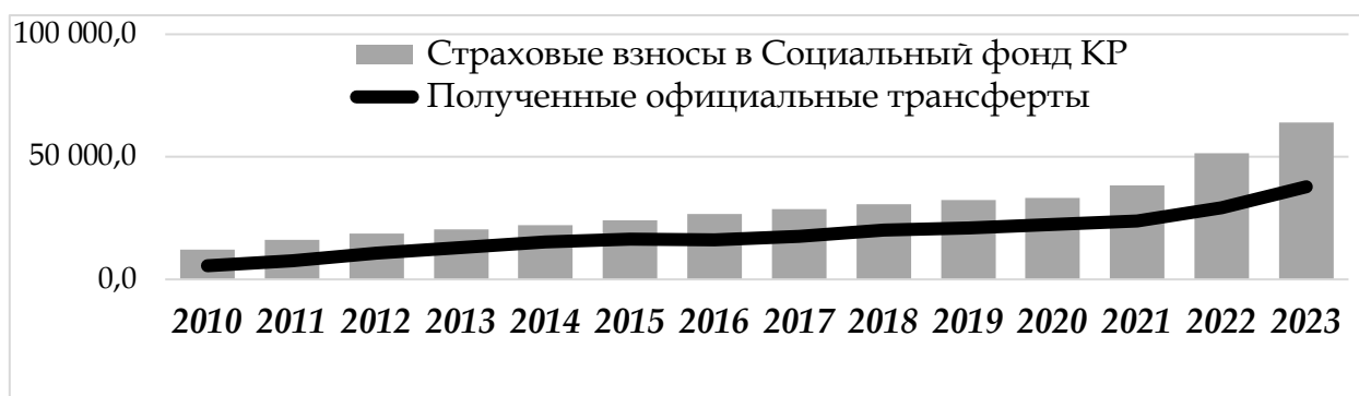
Рисунок 2. Динамика изменения страховых взносов и официальных трансфертов в Соцфонд КР, млн сом. [ https://cbd.minjust.gov.kg/4-3252/edition/1810/ru ]

Страховые взносы являются основным источником финансирования Соцфонда КР. За 2010-2023гг. наблюдался стабильный рост поступлений по этой статье, или сумма страховых взносов увеличилась с 12083,9 млн сом. до 63 964,0 млн сом. в 2023 г. [5; 1], или более чем в 5 раз (рис. 2), что свидетельствует о расширении базы плательщиков и увеличении доходов населения [3; 1; 2].