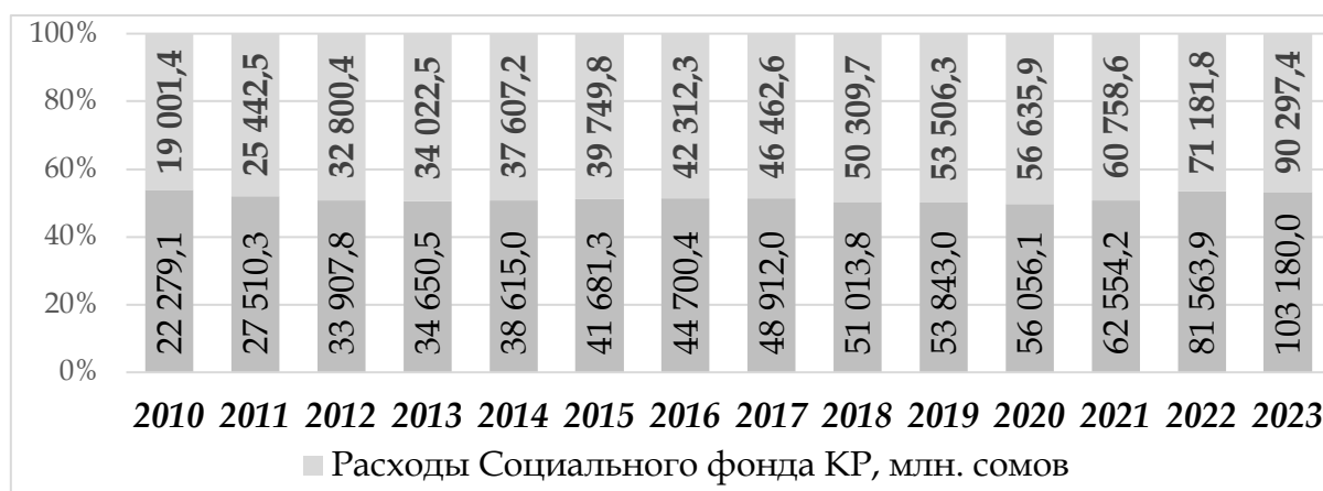
Рисунок 1. Динамика изменения доходов и расходов Соцфонда КР, млн сом.

Диагностика динамики доходов Соцфонда КР за 2010 – 2023гг. показала их рост. Так, если в 2010 г. доход составлял 22 279,1 млн сом., то в 2023 г. этот показатель увеличился до 103180 млн сом. [5; 1] (рис. 1).