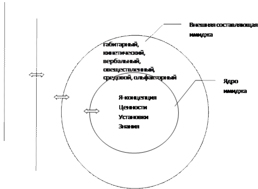
Рисунок 1. Динамическая модель личного имиджа

Раскроем подробнее описание составляющих предложенной модели элементов (рисунок 1). В иерархическую структуру диспозиций элементов, входящих в ядро имиджа автором включаются: поверхностный (низший) уровень диспозиций (знания, данные, представления о путях формирования имиджа); социальные фиксированные установки (аттитюды, складывающиеся на основе данных, знаний и в то же время существенно на них влияющие); систему ценностей (изменения в системе ценностей личности приводят к изменению набора его установок); «Я-концепцию».