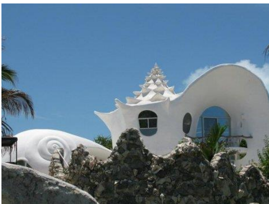
Здание ракушка. Мексика