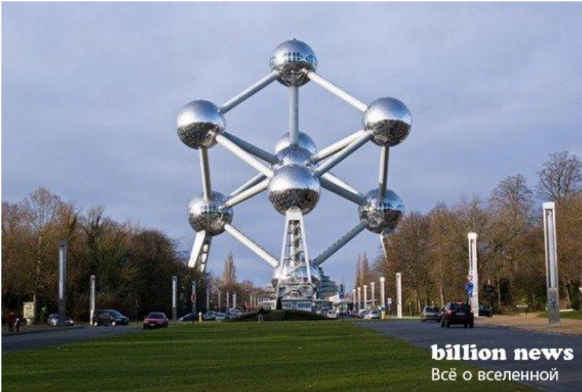
Дом-атом в Брюсселе. Бельгия