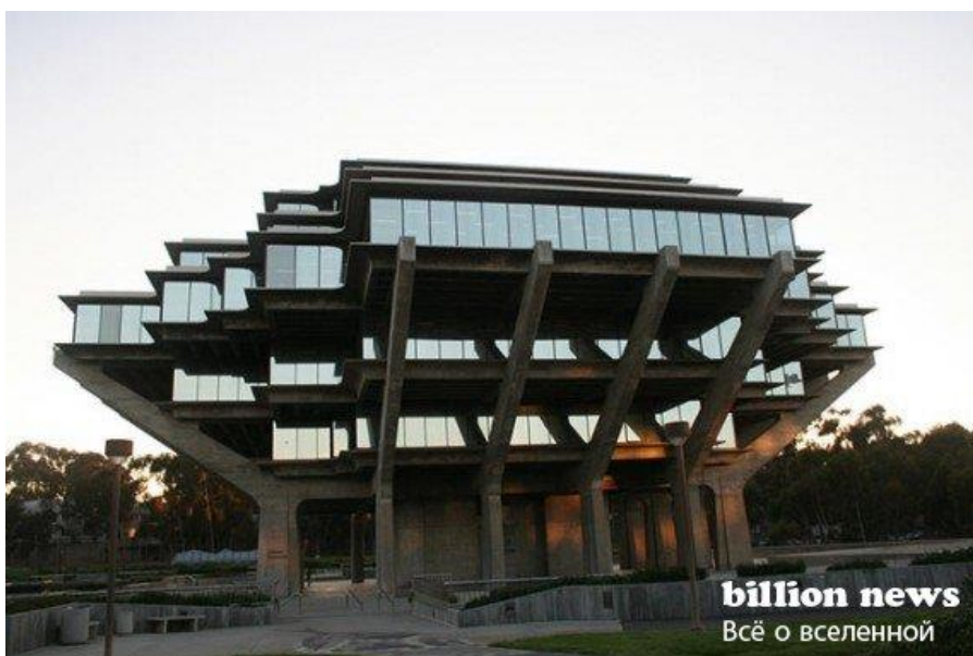
Библиотека в Сан-Диего. США