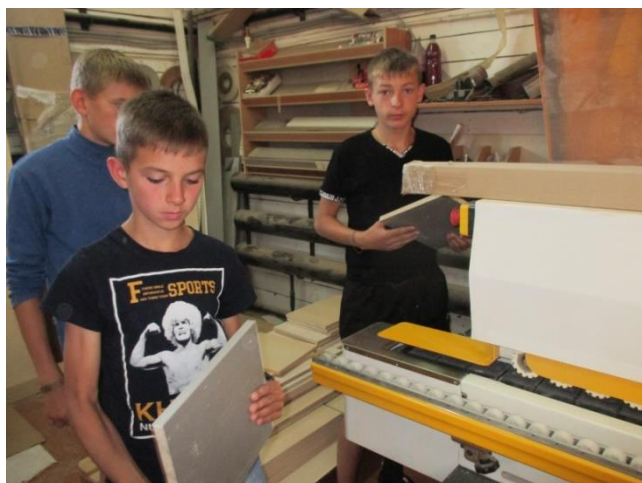
Экскурсия в мебельный цех