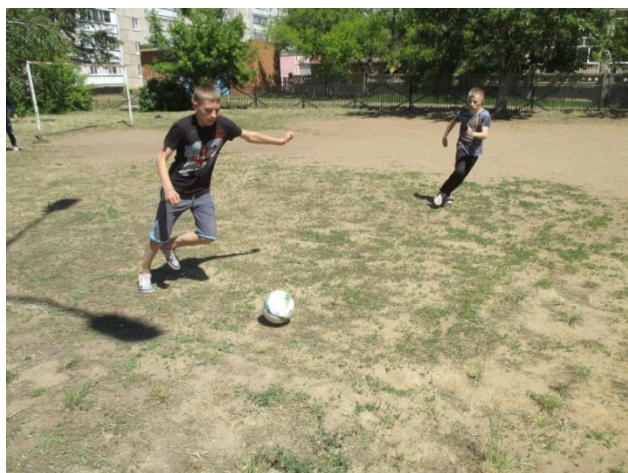
Семейный турнир по мини-футболу