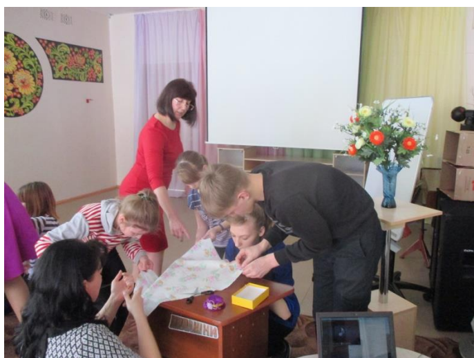
КВН «Веселый девичник»