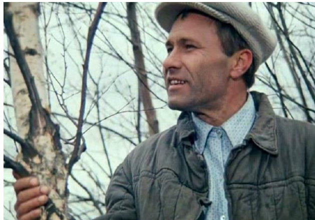
Кадр из фильма «Калина красная»

главной роли. Весной 1973 года в Вологодской области, под Белозерском Шукшин начал работу над фильмом "Калина красная",