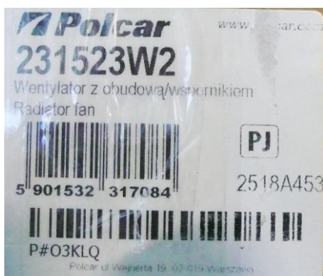
наклейка на упаковке