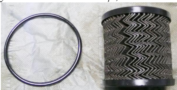
уплотнительное кольцо, элемент