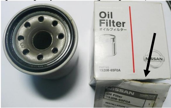
фильтр и упаковка (разорвана)