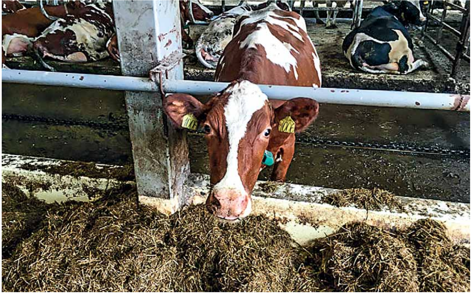
Viime vuonna karjatila tuotti noin 47 prosenttia maitoa vähemmän kuin toissa vuonna. KUVA: PTZGOVORIT.RU

Nyt paloasemalla on neljä autoa, joista yksi on uusi kuuden tonnin säiliöauto. Samanlaiset säiliöautot on tarkoitus hankkia kuluvana vuonna Kalevalan, Mujejärven, Louhen, Äänisenrannan ja Karhumäen piirien paloasemille. KS