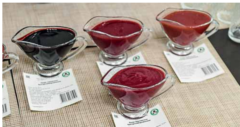
Zagotprom-yritys palkittiin hopeamitalilla pikapakastetusta sokeripitoisesta puolukkasoseestaan.