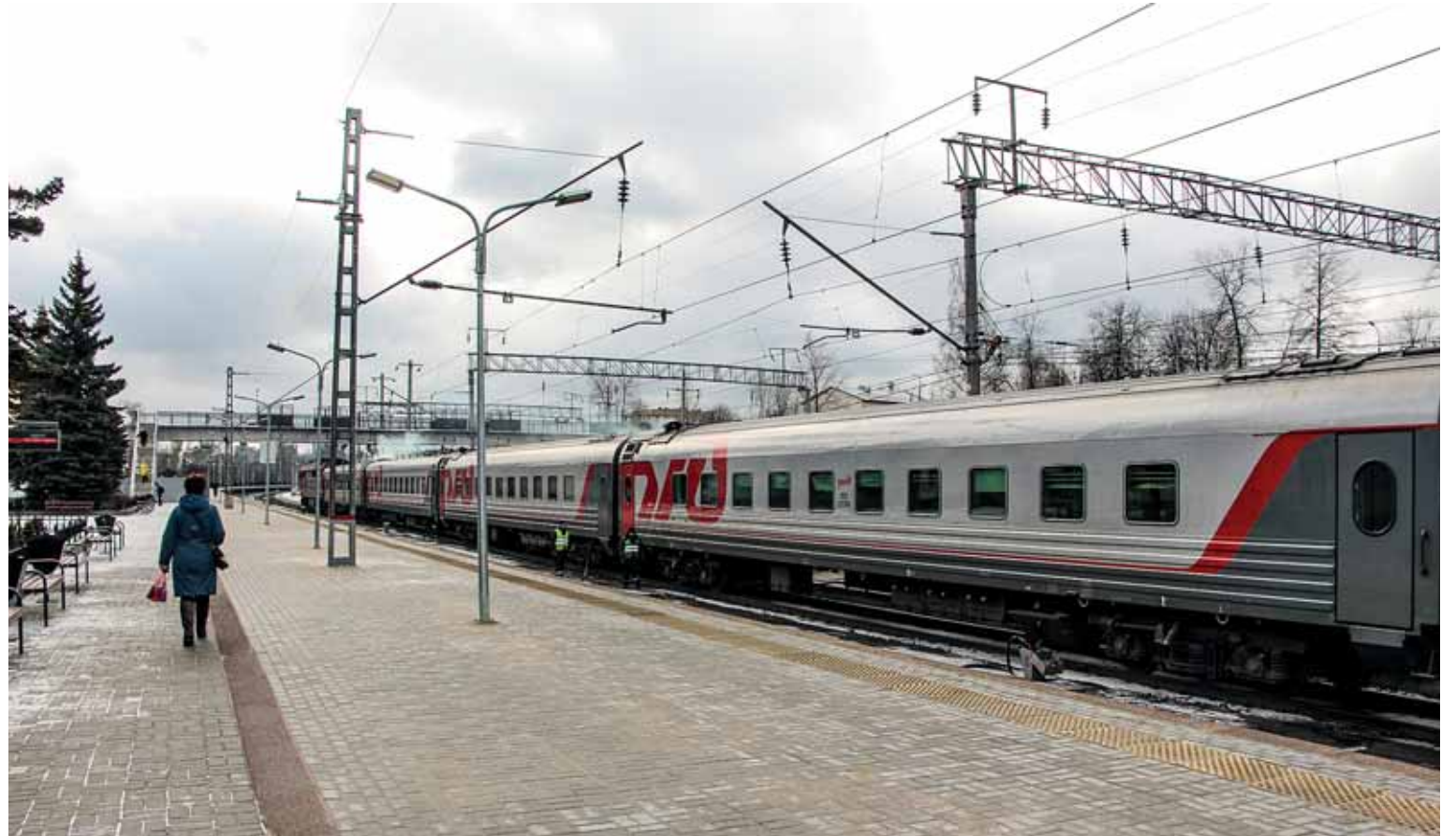
Elokuvajuna saapuu Petroskoin rautatieasemalle torstaina. Kuvaukset kestävät Petroskoissa viikon ajan. Petroskoilaisia osallistuu kuvauksiin.