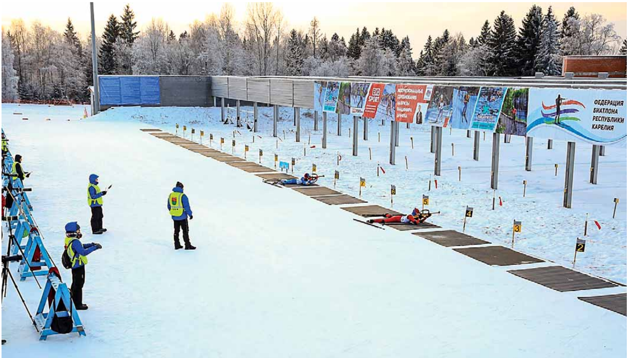
Petroskoin Kurgan-urheilukeskuksessa on 20 ampumapaikkaa, silloin kun kansainvälisen ampumahiihtoliiton sääntöjen mukaan kilpailuissa käytetään 30 ampumapaikkaa.