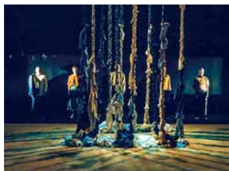
Näytelmässä teksti, musiikki, liike ja eri kielet ovat kaikki nivoutuneet yhteen.

12. maaliskuuta näytelmä esitetään Moskovassa ja 15. maaliskuuta Arkangelissa. KS 6+