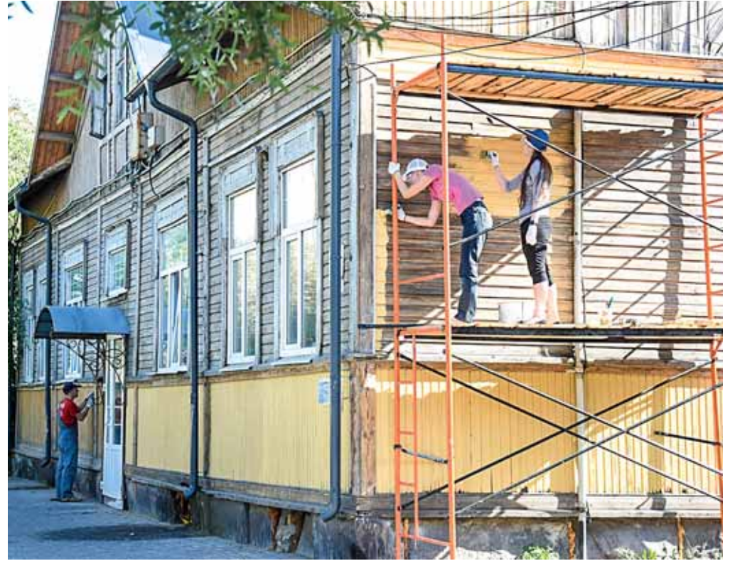
Viime kesänä vapaaehtoiset kunnostivat Karelskajakadulla sijaitsevan puutalon.

– Sodan aikana Sortavalan rakennukset kärsivät suuria tuhoja. Historialliset rakennukset ovat säilyneet kaupungin keskustassa. Monet Sortavalan rakennuksia suunnitelleet arkkitehdit työskentelivät Viipurissa ja Helsingissä. Nyt Venäjän kulttuuriministeriössä käsitellään kysymystä siitä, että Sortavala ja Viipuri kirjataan liittovaltion historial-