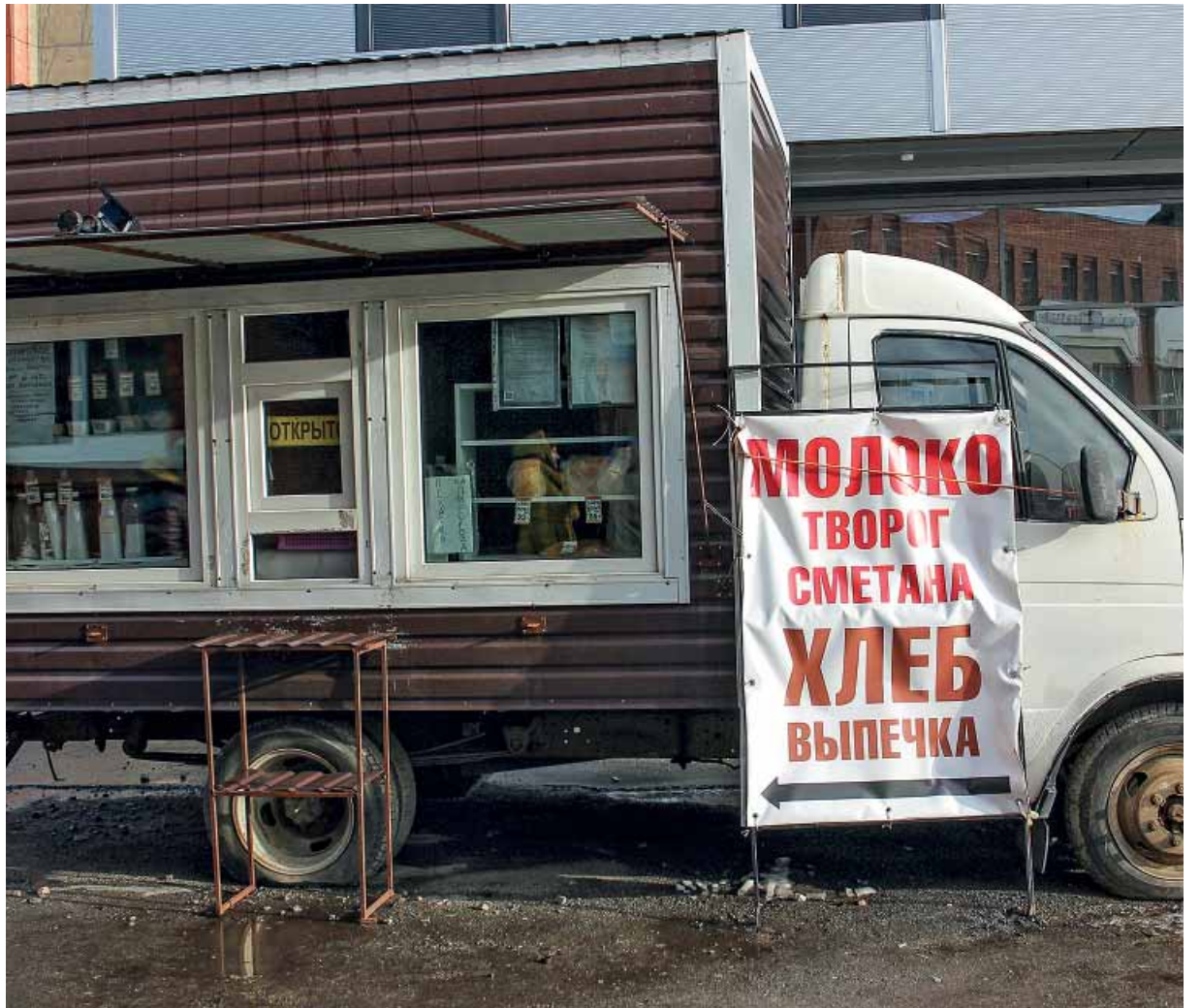
Myymäläauto kiertää kylissä, joissa asuu pari kymmentä asukasta.

Myymälä on avattu uudelleen Prääsan piirin Koivuselässä, taajaman asukkaita on alle sata. Myymälä toimi entisen kaupan tiloissa.