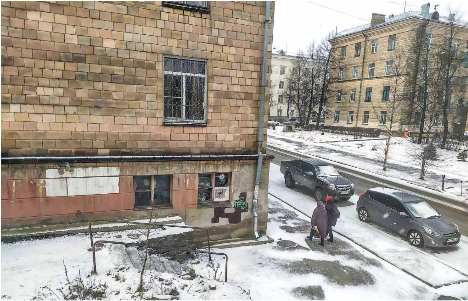
Petroskoin keskusta pitää suojata vandalismia vastaan.