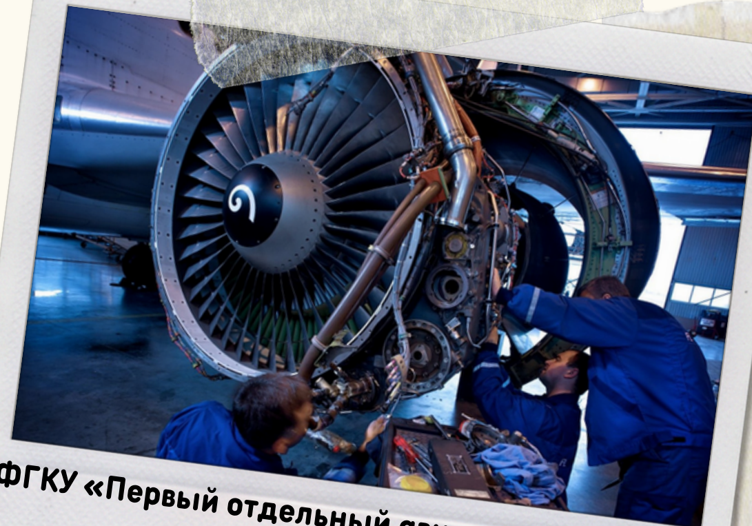
ФГКУ «Первый отдельный авиационный отряд»

Обучение в нашем Филиале является достойной гарантией того, что специалист будет востребован на рынке труда.