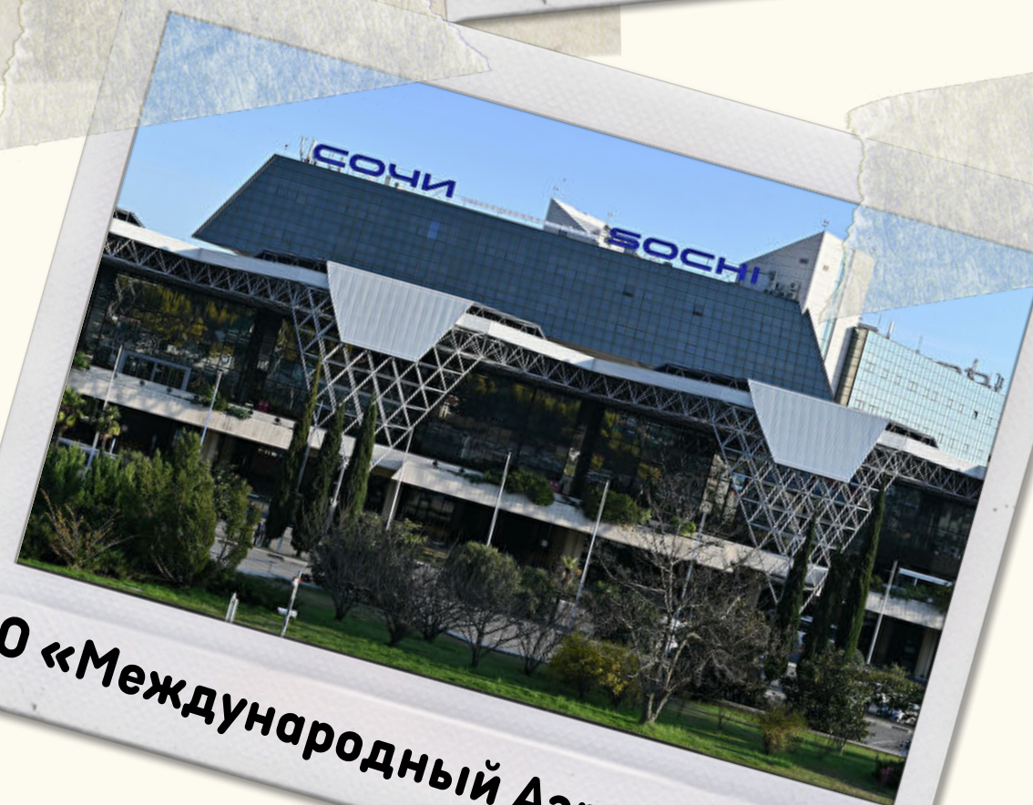
АО «Международный Аэропорт Сочи»