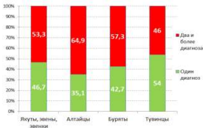
Рис. 2. Частота сочетанных нарушений (%).

Сочетанные нарушения чаще наблюдались у детей с расстройствами поведения: в РС(Я) у 53,3%, в РА у 64,9%, в АБО у 57,3%, в РТ у 46%. Наиболее часто встречались сочетания нарушений поведения с гиперкинетическими расстройствами: в РС(Я) у 42,2%, в РА у 40,4%, в АБО у 38,5%, в РТ у 44% детей и подростков. Сочетания нарушений поведения с эмоциональными расстройствами отмечались у 6,0% детей и подростков в РС(Я), у 10,6% в РА, у 5,2% в АБО и у 9% в РТ. Три и более диагноза поставлены 7,0% человек в РС(Я), 5,3% в РА, 8,3% в АБО. В целом, наибольшая коморбидность наблюдалась между расстройствами поведения и гиперкинетическими расстройствами с коэффициентом шансов 57,6 (95% ДИ = 26,8-54,9); (OR = 29,2; 95% CI = 16,4-51,8).