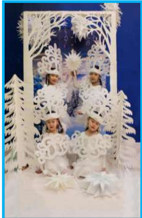
Хаар кыырпахтара .