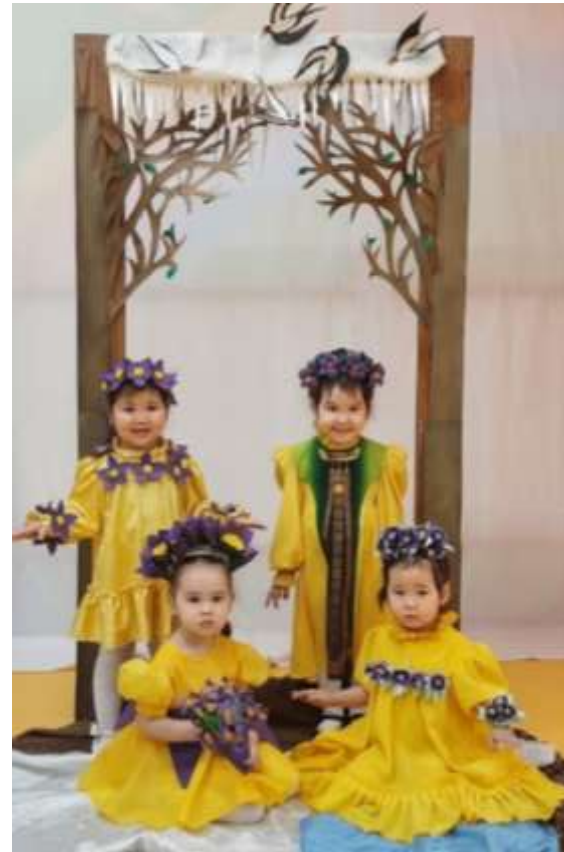
Сандал саас “ Айылба уһуктуута”