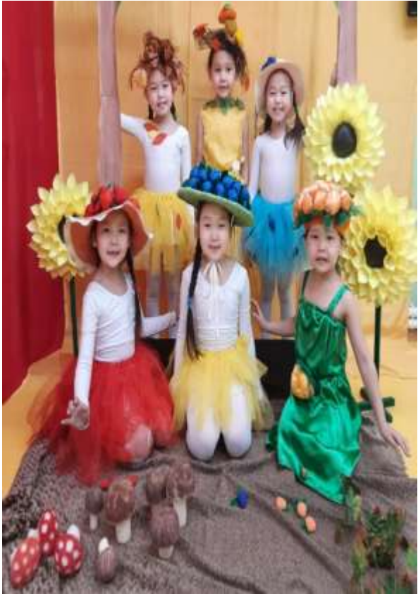
Көмүс күһүн. “Көмүс күһүн бэлэхтэрэ”.