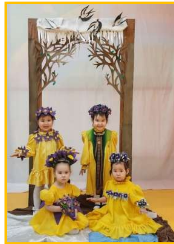
Кэрэ саас киэргэлэ- Ньургунун барахсан

Саас айылҕа уһуктар, сылыйар, сир ирэр, хаар уулар, кус-хаас кэлэр диэн билэр. Кун чабылыччы тыгар, ититэр, халлаан сырдыыр, сылыйар, хаар уулар, чалбах тахсар, сир ирэр, күөл, үрэх мууһа алдьанар, устар, барар, уунан штуолар, сыккыстар сүүрэллэр, от-мас тыллар, хонуу, мутукча көбөрөр, ньургунун тахсар, сир-дойду сэргэхсийэр. Ол иһин үөн-көйүүр тиллэр, сибэкки тыллар, чыычаах ыллыыр, уйа туттар, сыммыт баттыыр, көтөр кынаттаах итии дойдуттан төннөр, кыыл – сүөл уйатыттан – хороонуттан тахсар диэн билэр, быһаарар. Дьон-сэргэ олобор сааскы үлэ – хамнас саҕаланар (сир хоротуута, ыһыы үлэтэ, оҕоруот аһын олордута, ыраастаныы – хомунуу), дьизэ сүөһүтэ төрүүр-уһуур, оҕо-аймах ойуурга, хонууга сыһыыга күүлэйдиир, араас походтарга, экскурсияларга сылдыаллар диэн өйдүүр, билэр.