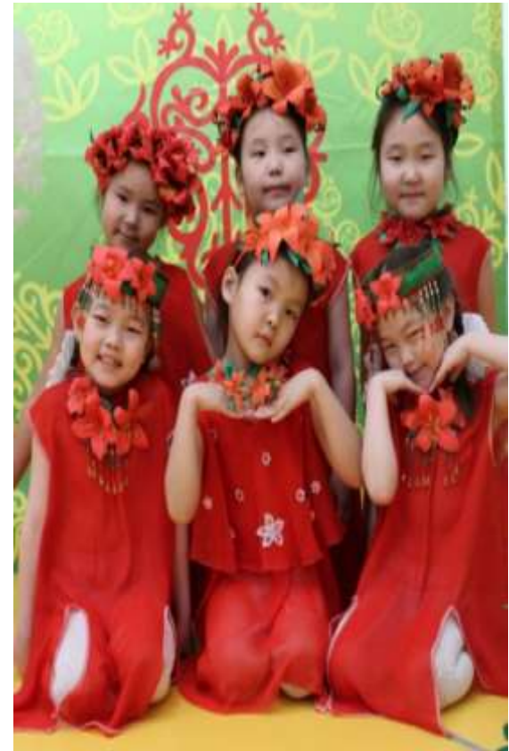
Самаан сайын. “ Сир симэхтэрэ “.