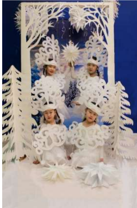
Кыыдаан кыһын. “Хаар кыырпахтара”.