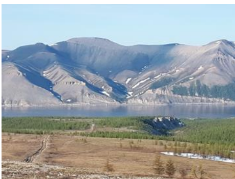
Рыболовецкий участок Чекуров