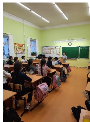
Итог нашей работы – классный час