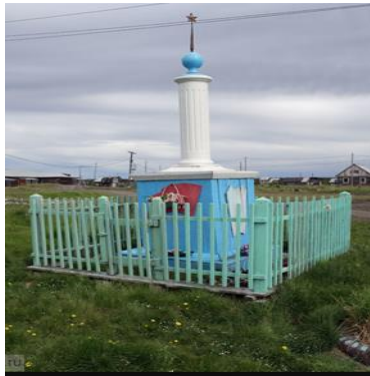
Памятник 273 красногвардейскому полку