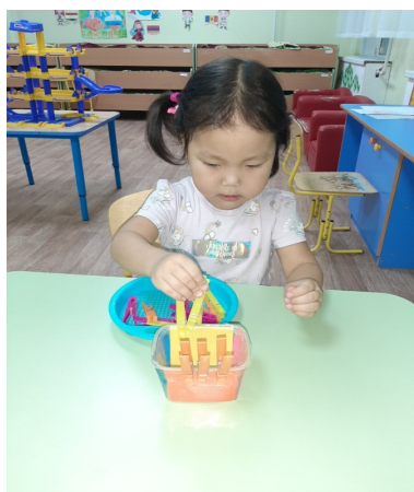
Дьүһүннэринэн көрөн прищепкалары сөпкө иилэри ситиһии.