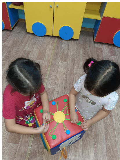
Замок замоктуурга, тимэх тимэхтииргэ үөрэтии.