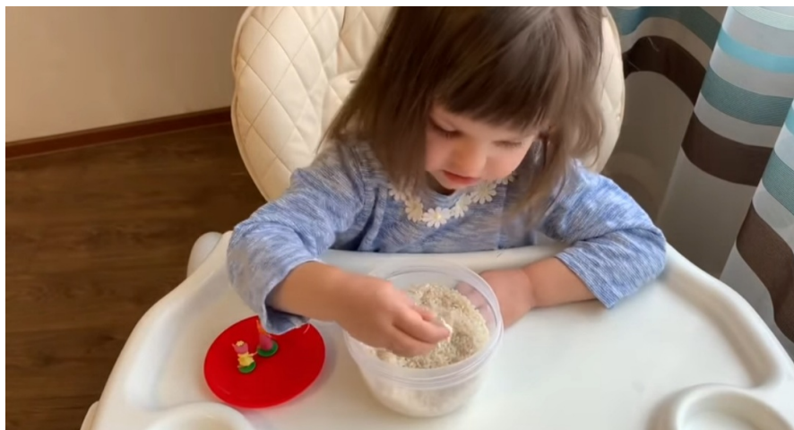
Саспыт оонньуурдары крупаттан көрдөөн булуу.