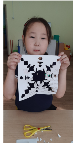
Кыптыыйынан фигуралары кырыйтарыы.