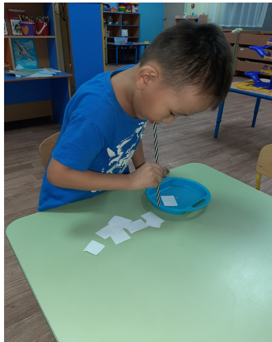
Трубканын чэпчэки этиктэри (предметы) оборон иһиккэ уурдары.