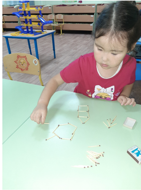
Испийскэ атабынан араас фигуралары онотторуу.