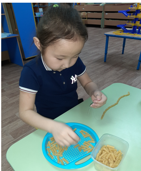
Улахан хайбагстаах макароннары сапка тистэри.