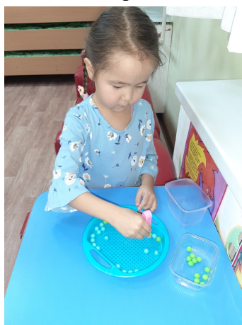
Пинцет көмөгүнэн обуруолары наардааһын.