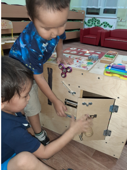
Туттуллубат материалларынан бизиборд онорон оонньотуу.