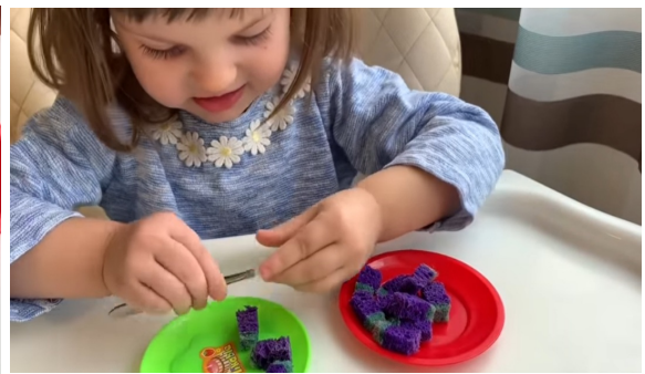
Губканы кырыйан пинцет көмөтүнэн атын иһиккэ уурдарыы.