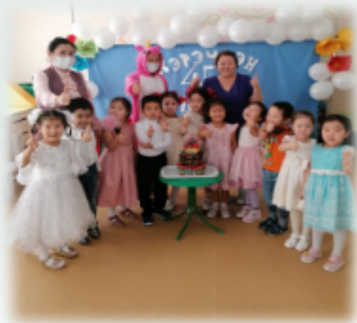
День рождения детского сада 2021