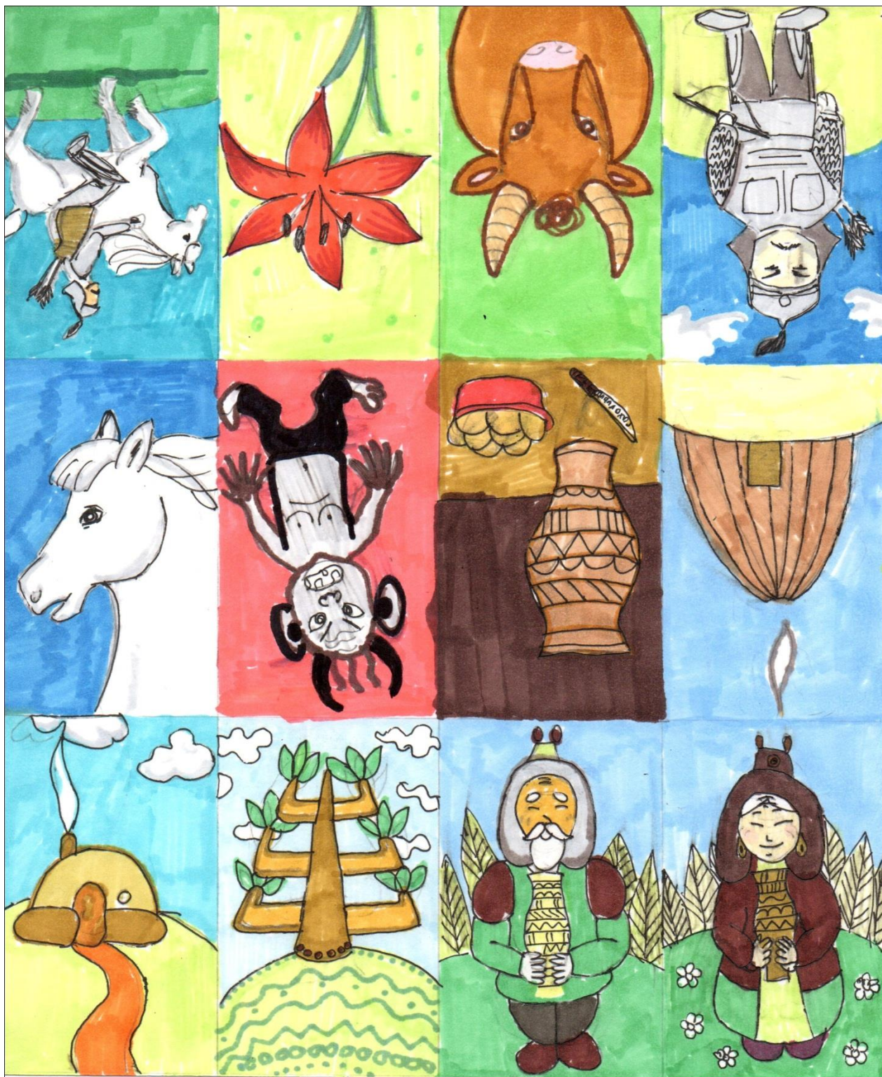
«Паратын бул» карточканан оонһуу уруһуя