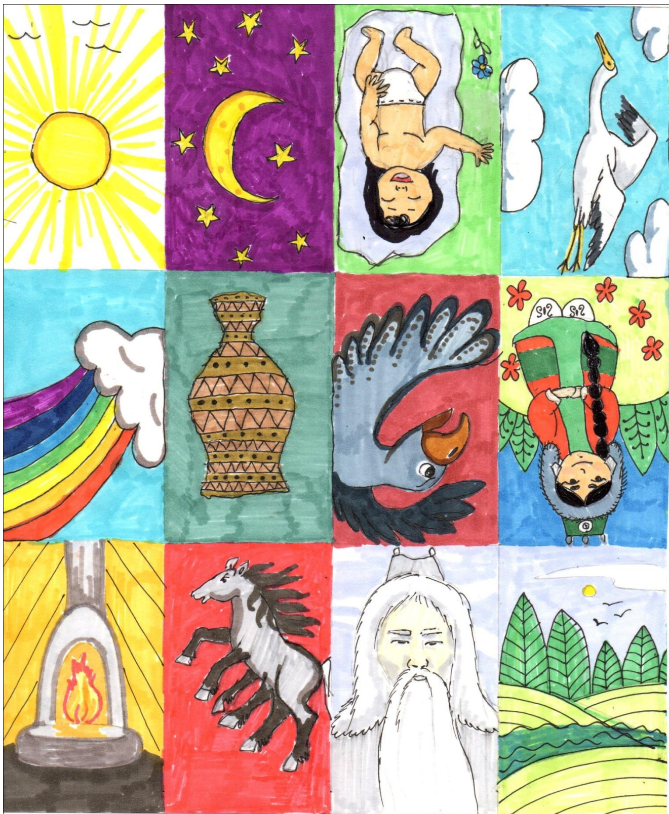
«Паратын бул» карточканын ооньнуу урууыа