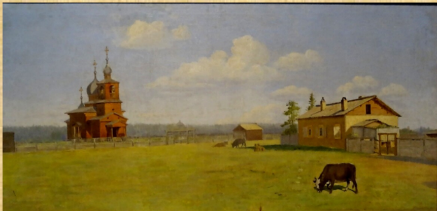
“Преображенская церковь в п. Ытык-Куел”