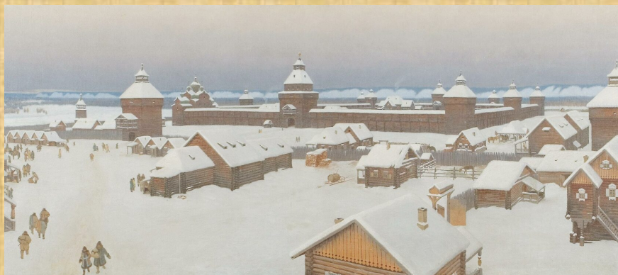
“Якутск конца 17 века”