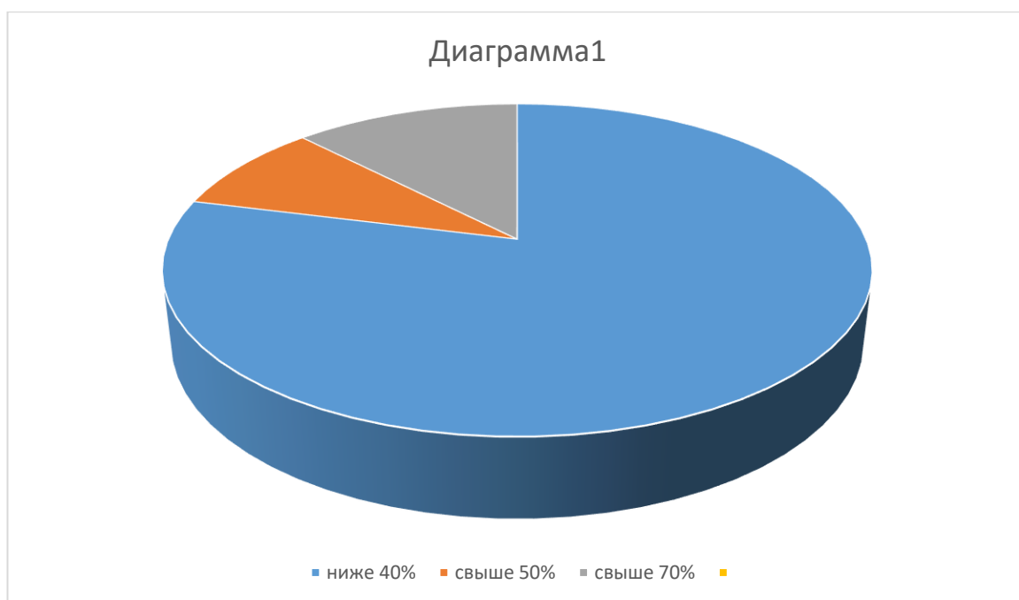
Диаграмма - 1. Итоги проверочного тестирования

Проверочная работа состояла из 3 заданий и проверяла знания учащихся по следующим разделам: