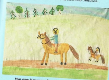
Мин чуҕас дьоннорум. Протодьяконова Лена, 5 саастаах