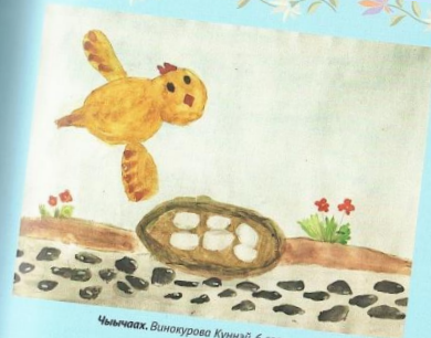
Чыычаах. Винокурова Күнээ, 6 саастаах

Хаарынан бырахса ооньуохтүт, Хаар кийи огорон үөрүөхтүт, Манганчаан, сырдыкчаан хаарчааныам, Маннайгы хаарынан эбэрдэ!