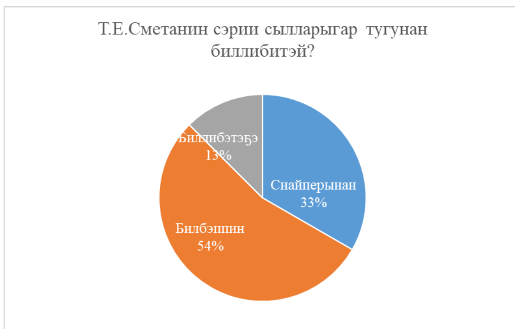
Рис. 3. “Т.Е.Сметанин сэрии сылларыгар тугунан биллибитэй?” диэн хоруй эппиэттэрэ.

Кылааһым оҕолоруттан хомойуох иһин ким даҕаны “Саллаат сүрэмэ” хомуурунньугу ааҕа илик эбит.