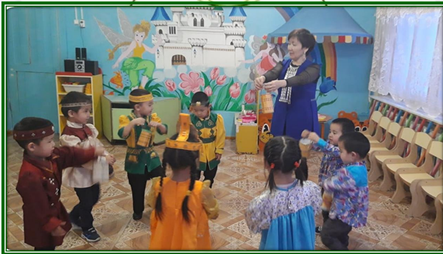
Физминутка под музыку « Амсат эрэ дьэдьэнниттэн »