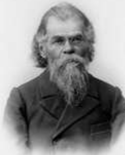
Г. Н. Потанин