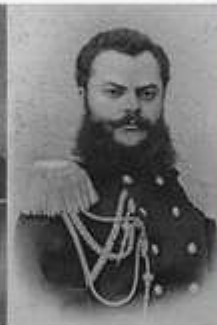
Граф П. И. Кутайсов