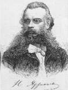
Н. М. Ядринцев