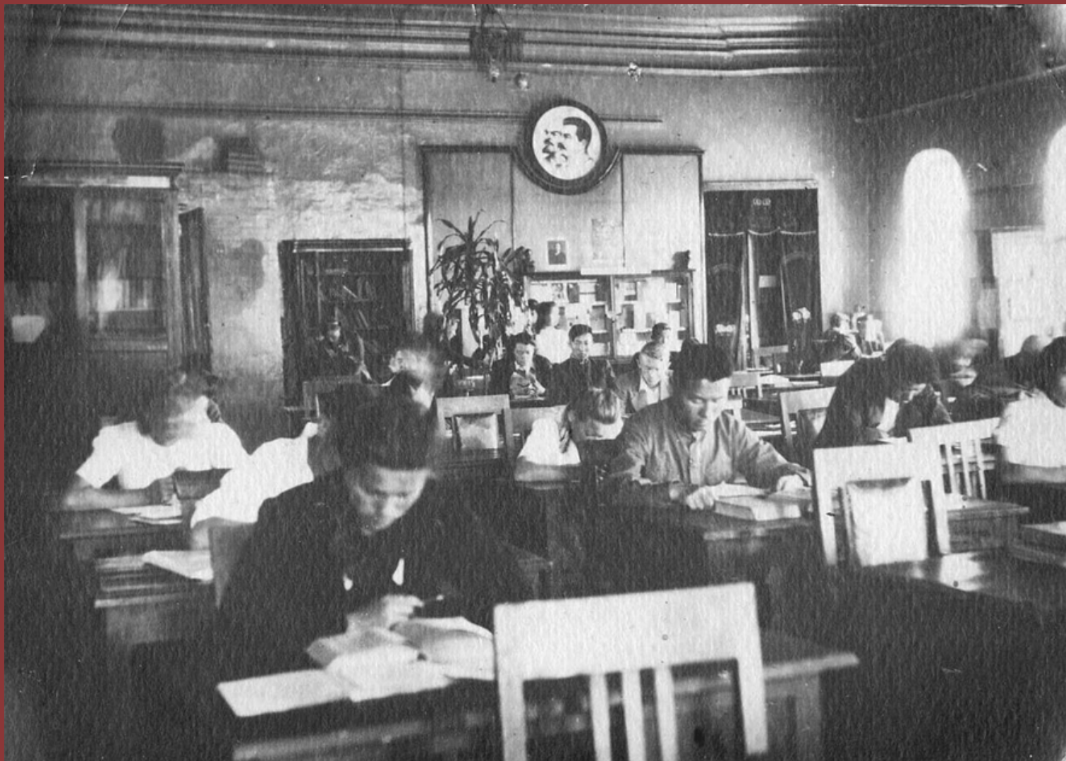
Первая народная библиотека- читальня открылась в Якутске 21 августа 1898 года.