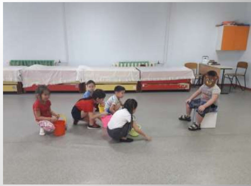
Игра «У Медведя во бору»