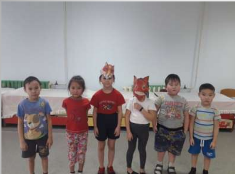
Игра «Хитрая лиса»