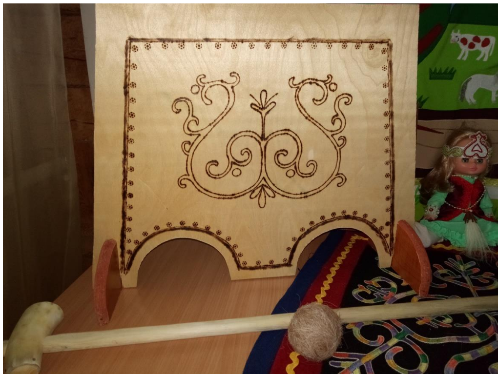
Ооньуу аата: «Таба киллэр»

Оонньооччу оџо сааһа: 4-6 саастаах оџолорго.