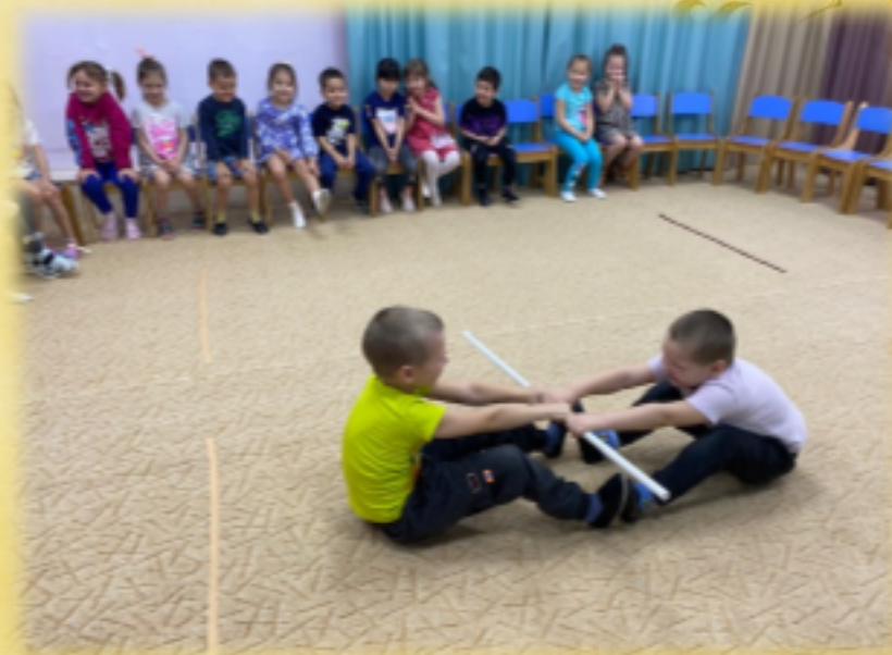
Игра: «Перетягивание палки».