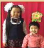
Вика и я