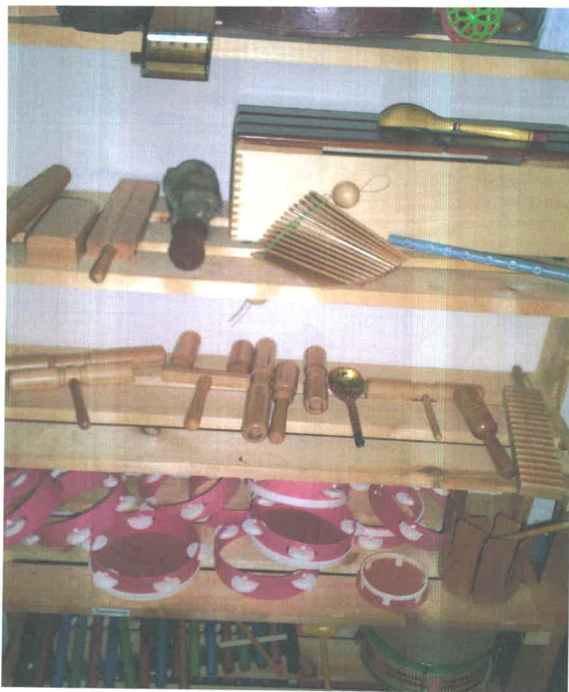
Зона ударных музыкальных инструментов и якутских народных инструментов.