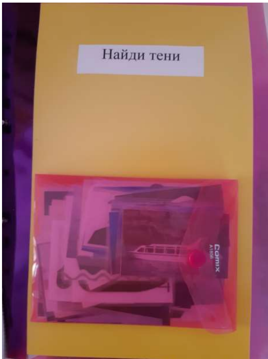
Д/и «Найди тень»