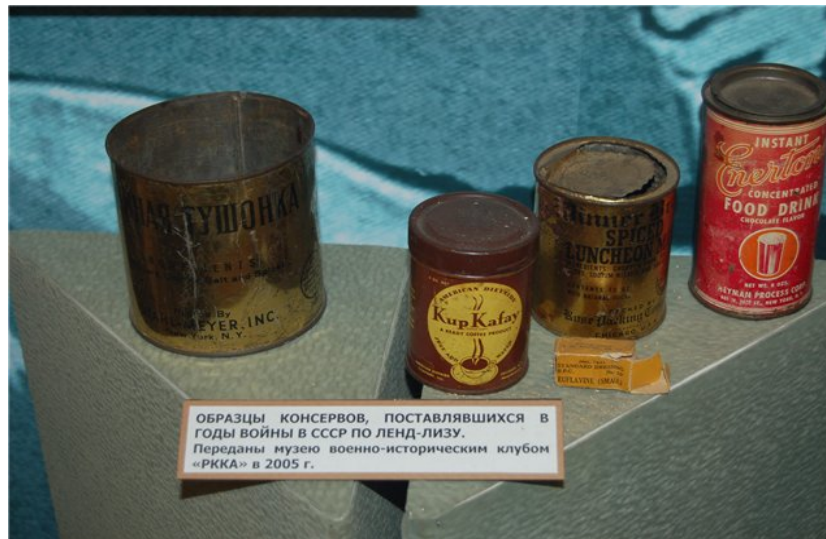
ОБРАЗЦЫ КОНСЕРВОВ, ПОСТАВЛЯВШИХСЯ В ГОДЫ ВОЙНЫ В СССР ПО ЛЕНД-ЛИЗУ. Переданы музею военно-историческим клубом «РККА» в 2005 г.