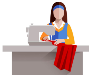
Пошив заказа на швейной машине