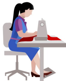
Шьём на швейной машинке