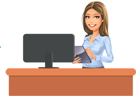
Работа с терминалом