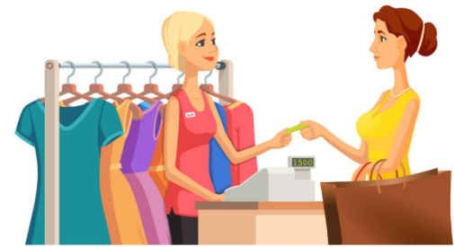
Работа с кассовым аппаратом