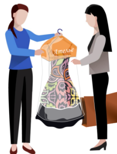
Получение готового изделия