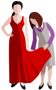
контроль качества кроя