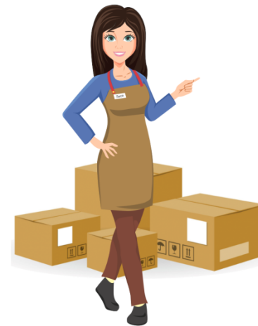
Байер (менеджер по закупкам)