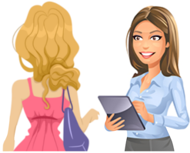
Встречает гостей Ателье, прием заказов