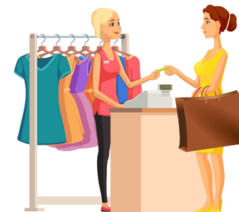
Оплата заказа на кассе