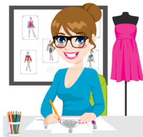
Зарисовывает выбранный вариант заказа