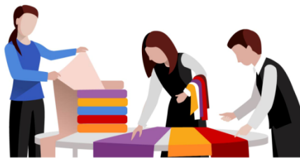
Контроль работы над заказом