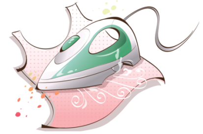
Чистка и глажка готового изделия