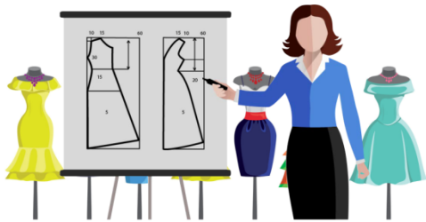
Помогает клиенту в выборе фасона