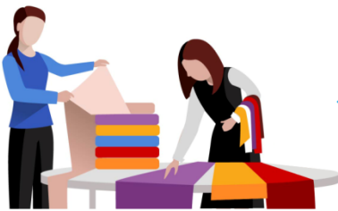
Помогает клиенту в выборе ткани