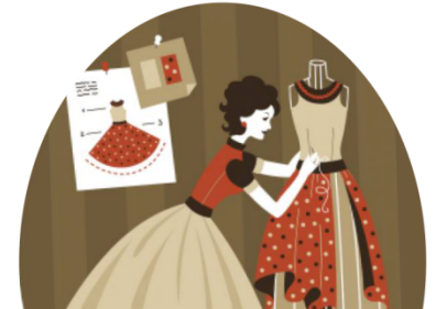
Проверка соответствия изделия с заказом