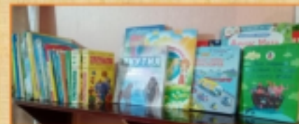
Полка детских книг