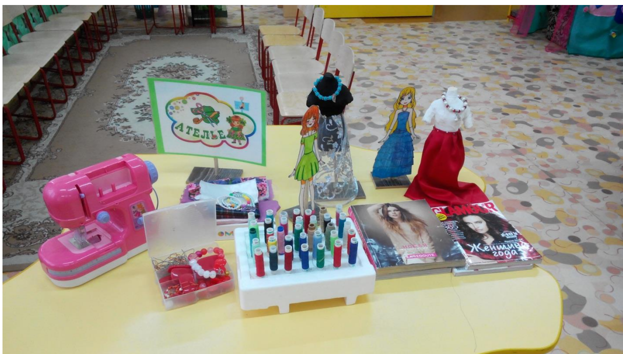
Атрибуты к сюжетно-ролевой игре «Ателье».

Дошкольный возраст – самое начало жизни ребенка, когда он только начинает осознавать себя личностью с собственными желаниями и возможностями и открывает для себя окружающий мир. Психологи считают, что сюжетно - ролевая игра – это высшая форма развития детской игры, в дошкольном возрасте она выступает в роли ведущей деятельности. Сюжетно - ролевые игры имеют большое значение в психическом развитии ребенка, они развивают произвольное внимание, память. Правила, обязательные при проведении игры, воспитывают у детей умение контролировать свое поведение, тем самым способствуют формированию характера. Во время совместной игры со сверстниками дети учатся общению, совместно строить и реализовывать планы. Успешность сюжетно-ролевой игры, зависит от организации педагога. Необходимо создать условия для игры - предметно-пространственную игровую среду с учётом индивидуальных и возрастных особенностей дошкольников. Атрибуты для сюжетно-ролевых игр должны быть красочными и эстетическими. Предлагаю вашему вниманию как можно своими руками сделать атрибуты для игры в «Ателье», «Кафе», «Почта».