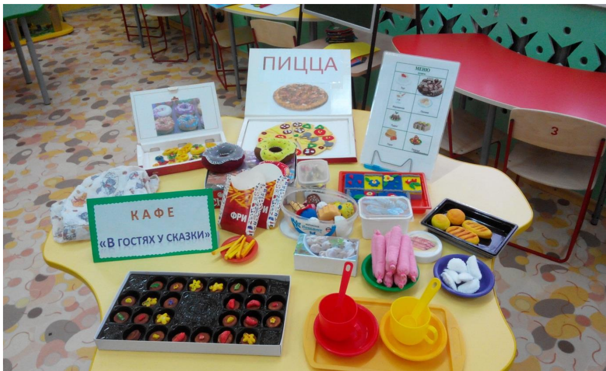
Атрибуты к сюжетно-ролевой игре «Кафе»